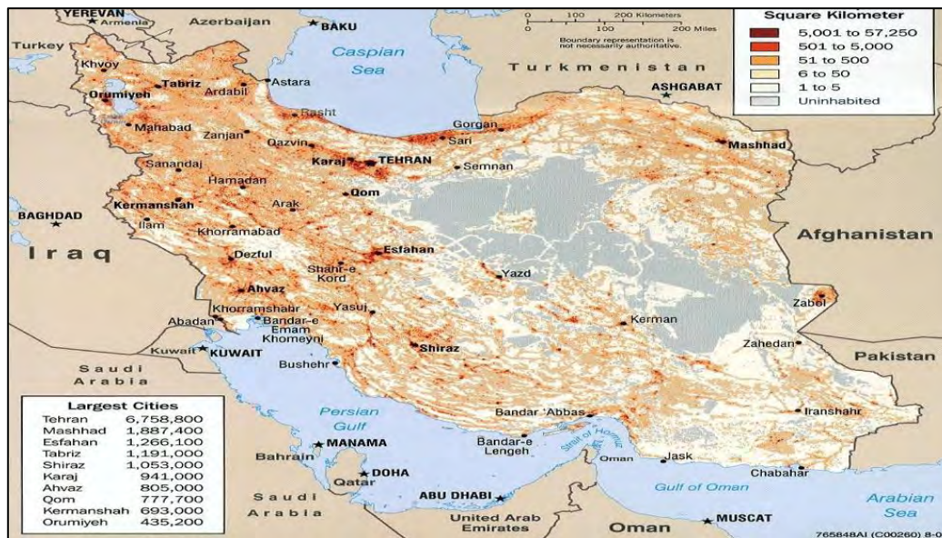
نقشه ۳. پراکنندگی و سکونت جمعیت در ایران