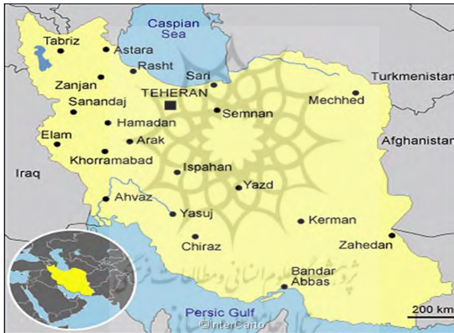
نقشه ۱. موقعیت جغرافیایی ایران

ایران با نام رسمی جمهوری اسلامی ایران در آسیای غربی واقع است. در شمال غرب با ارمنستان، جمهوری نیمه‌رسمی قره‌باغ و جمهوری آذربایجان، در شمال با دریای خزر، در شمال‌شرق با ترکمنستان، در شرق با افغانستان و پاکستان، در جنوب با دریای عُمّان و خلیج فارس و در غرب با ترکیه و عراق، کرانمند است و مرز خاکی دارد (مسعودیان، ۱۳۸۲: ۱۷۲). ۱۶۴۸۱۹۵ کیلومتر مربع مساحت دارد که دومین کشور بزرگ خاورمیانه و هجدهمین در جهان می‌باشد. با ۸۲/۸ میلیون نفر جمعیت، هفدهمین کشور پرجمعیت جهان است. تنها کشوری است که با هر دو دریای خزر و اقیانوس هند خط ساحلی دارد. جایگیری ایران در اوراسیا و غرب آسیا و نزدیکی آن به تنگه هُرمُز، به این کشور برجستگی ژئوپولیتیکی بخشیده است. تهران پایتخت کشور و بزرگترین شهر ایران است و همچنین قانون پیشتاز اقتصادی آن (همان، ۱۳۸۲: ۱۷۶).