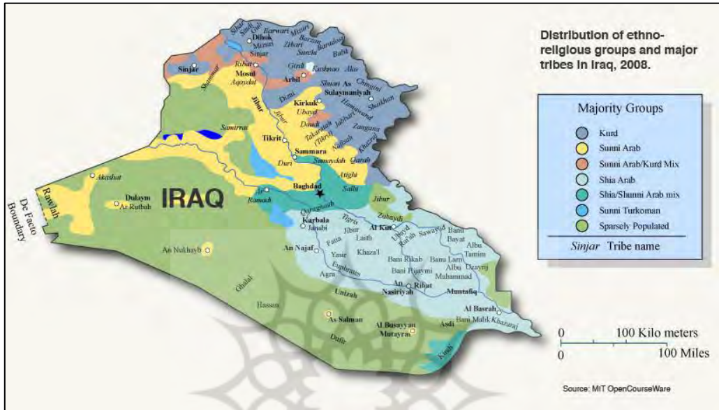
نقشه ۱: تقسیمات سیاسی عراق

خواهد گرفت. قوای حکومتی شامل قوه قضائیه، قوه مجریه و قوه مقننه می‌باشد و در حال حاضر از نماینده پارلمان حدود کرسی در اختیار شیعیان است و ائتلاف عراق یکپارچه که عمدتاً متشکل از احزاب و گروه‌های اسلامی شیعی چون حزب الدعوة، مجلس اعلی و گروه صدر است، بر پارلمان عراق مسلط می‌باشند. نخست وزیر کنونی شیعی مذهب عراق، نوری مالکی نیز از اعضای ارشد حزب الدعوة می‌باشد.