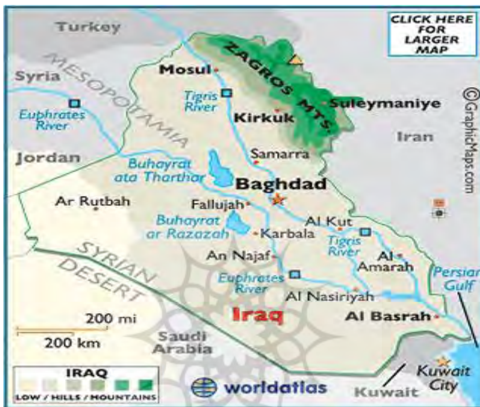
نقشه ۳: توپوگرافی عراق

است و ریاست آن را عدنان الدلیمی برعهده دارد و رهبری جبهه گفت و گوی ملی عراق نیز بر عهده صالح مطلق می‌باشد.