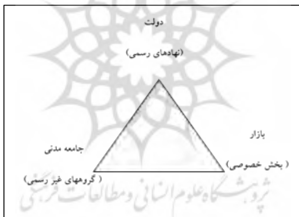
شکل ۱- هرم کنشگران حکمروایی مطلوب شهری

جهانی ۱ اصطلاح "حکمروایی مطلوب" را اولین بار وارد گفتمان توسعه کرد (Sadashiva, 2008:7) و سپس از طریق نهادهای مهم بین المللی توسعه، همانند بانک توسعه آسیا در سال ۱۹۹۵، صندوق بین المللی پول با توجه به تجارب خوب شفافیت مالی در سال ۱۹۹۶، برنامه توسعه سازمان ملل متحد در سال ۱۹۹۷ به جریان عادی ادبیات موجود تبدیل شد (Roberts et al, 2007:970). سازمان اخیر حکمروایی مطلوب را مشارکت برابر همه شهروندان در تصمیم گیری (UNDP, 2005) می داند که نه تنها شامل دولت بلکه همچنین شامل جامعه مدنی و بازار است (Roberts et al, 2007:967) که نهایتاً به ایجاد شرایط قانونمندی و کنش جمعی کمک می کند حکمروایی مطلوب شهری در این معنی حاوی معنایی دوگانه است. به این ترتیب که در یک سمت این مفهوم به تجلیات تجربی انطباق دولت با محیط بیرونی و از طرف دیگر بر الگوی مفهومی یا نظری همبازی نظامات اجتماعی و نقش دولت در این فرایند مربوط است (Bhuiyan, 2010:126). بنابراین هرم حکمروایی شهری حامل سه عنصر فوق خواهد بود که فقط یک ضلع آن مربوط به دخالت دولت است و اضلاع دیگر آن متحمل حضور جامعه مدنی و بازار است (شکل ۱)