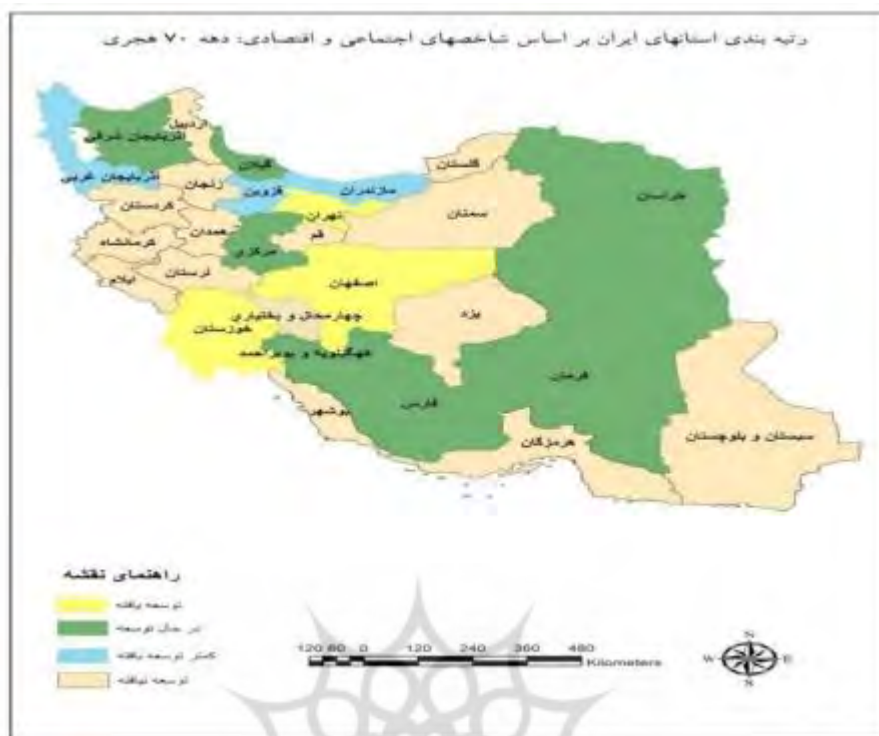
نقشه ۱: سطح بندی توسعه استان‌های ایران دهه ۷۰