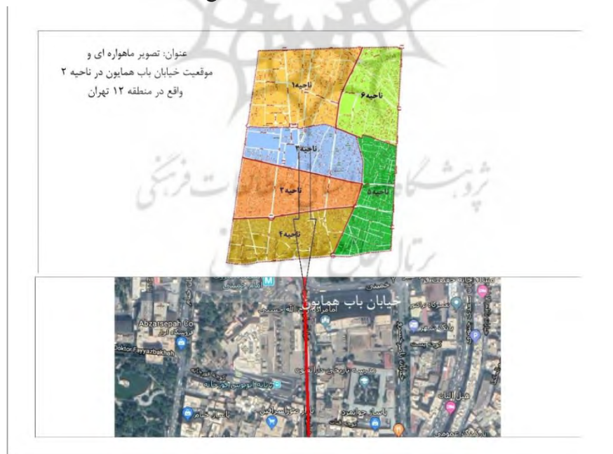
شکل ۱: تصویر ماهواره‌ای محدوده مورد مطالعه در ناحیه ۲، منطقه ۱۲