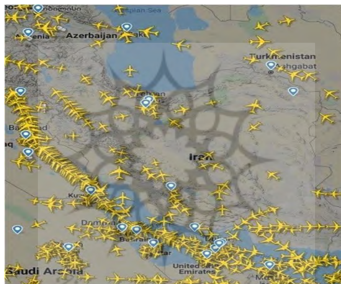
شکل ۳. پروازهای عبوری از آسمان ایران در زمان فروکش کردن جنگ با داعش