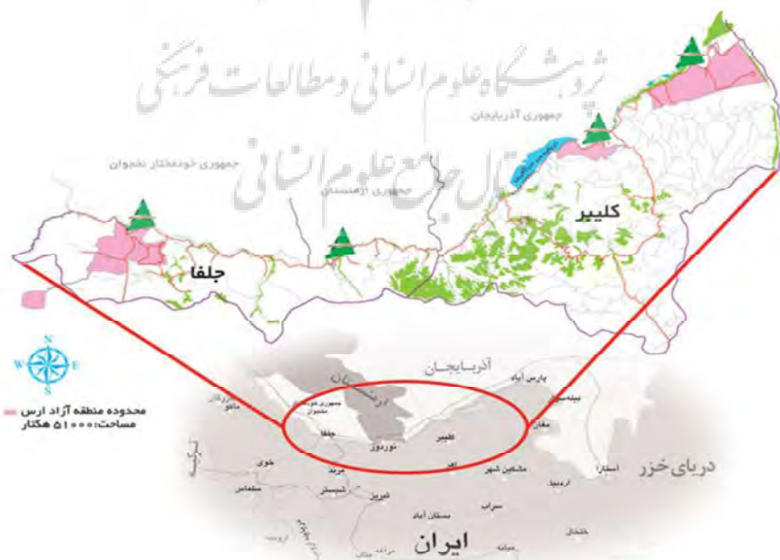
شکل (۲): موقعیت جغرافیایی منطقه آزاد ارس

از روستاهای تاریخی و طبیعی منطقه می‌توان به روستای تاریخی و زیبای اشتین (ماسوله آذربایجان)، روستای سیاحتی - زیارتی زاویه، روستای تاریخی کوردشت، روستای زیبای قشلاق (منطقه‌ی ماهاران) اشاره کرد. همچنین حمام‌های تاریخی منطق عبارتند از: حمام کوردشت و حمام جلفا: امامزاده سید محمدآقا (نوجه مهر)، امامزاده شعیب (دوزال)، امامزاده سید اسماعیل (زاویه)، بقعه‌ی بابا یعقوب، مقبره‌ی حکیم ابولقاسم نباتی، آرامگاه جرجیس پیامبر از جمله آرامگاه و اماکن متبرکه هستند. این منطقه به سبب گذشته تاریخی دارای اقلع متنوعی همچون قلعه‌ی علی بیگ، قلعه‌ی گوهر (گاوور)، قلعه‌ی مرزاد (گور قلعه‌سی)، قلعه‌ی کوردشت می‌باشد. از جاذبه‌های طبیعی و اکوتوریستی این منطقه می‌توان به مناظر طبیعی: آبشار آسیاب، کوه کیامکی و کوه کنتال (کمتال)، جنگل‌های ارسباران، آبشار ماهاران، سد ارس، پناهگاه حیات وحش کیامکی و مراکان اشاره نمود. مضافاً اینکه این منطقه دارای انواع مجتمع‌های تجاری بین‌المللی از جمله ستارخان و برلیان می‌باشد.