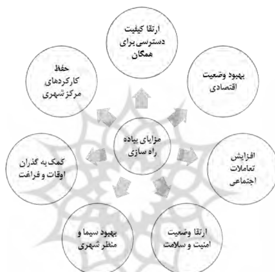
نمودار (۱): مهمترین مزایای پیاده‌محوری با توجه به ویژگی‌های فیزیکی انسان (صادقی: ۱۳۹۵؛ اسداللهی: ۱۳۸۳).

در اکثر شهرهای معاصر ما به دلیل غفلت از توجه به جنبه‌های انسانی فضاهای شهری، مسیرهای شهری نقشی به عنوان عامل دسترسی به خود گرفته که در نتیجه آن، حضور شهروندان در خیابان به عنوان فضای شهری کم‌رنگ شده و سبب شده که فعالیت‌های اجتماعی و حیات شهری معنای خود را از دست بدهد. نمودار (۱)