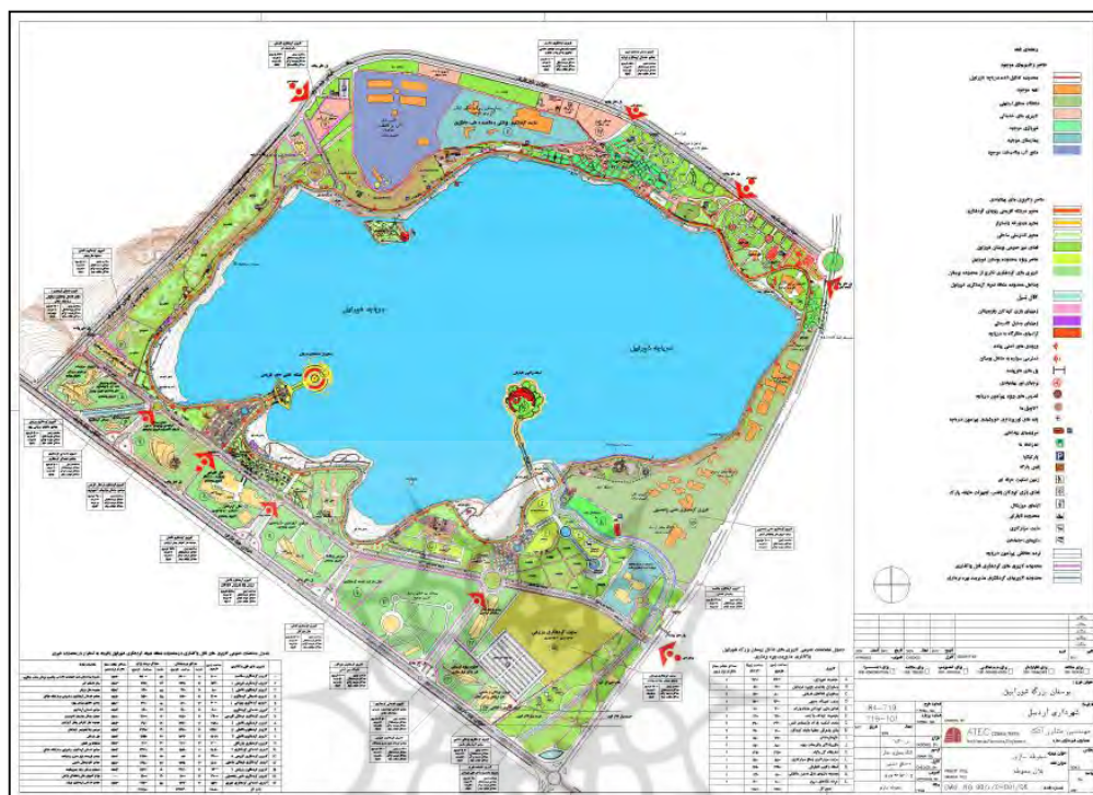
شکل (۲): کاربری اراضی محدوده منطقه نمونه گردشگری

دوچرخه سواری، باغ وحش، هتل‌های مجهز و زیبا، مجموعه شهرسازی برای بچه‌ها، رستوران در وسط دریاچه و... است. این دریاچه در ۴۸ کیلومتری جنوب شرقی اردبیل بطرف خلخال در یکی از دره‌های کوهستان باغیروو در ارتفاع ۲۵۰۰ متری از سطح دریا با مساحتی بالغ بر ۲۱۰ هکتار و عمق متوسط پنج متر یکی از زیباترین و دیدنی‌ترین دریاچه‌های ایران می‌باشد. شکل (۲) کاربری اراضی محدوده منطقه نمونه گردشگری شورابیل را نمایش می‌دهد.