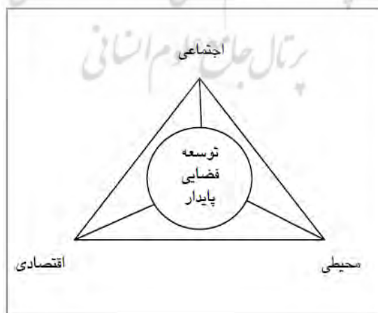
شکل ۱: مثلث سه وجهی توسعه فضایی پایدار

عدالت محیطی جنبشی اجتماعی است برای حمایت از کسانی که بار مخاطرات زیست‌محیطی را بر دوش دارند. این جنبش که از اوایل دهه ۱۹۸۰ آغاز شد، تلاش دارد تا مانع تبدیل اجتماعات اقلیت و کم‌درآمد به مزبله صنایع و اقشار بهره‌مند جامعه شود. کوشش دیگر جنبش این است که کارگران را از قرار گرفتن در معرض مواد سمی و پرتوهای زیان‌بار بازدارد. در ایالات متحده و سایر کشورهای شمال، جنبش عدالت زیست‌محیطی هم اجتماعات شهری و هم روستایی را که بار مخاطرات محیطی را تحمل می‌کنند، در برمی‌گیرد. عدالت زیست‌محیطی، به‌عنوان یک جنبش اجتماعی، عبارت است از مجموعه همبستگی‌های ضعیف بین گروه‌هایی که اندیشه مشترک دارند و برای هدف‌های مشابه فعالیت می‌کنند نظیر کیفیت محیط‌زیست شهری، کاهش صنایع مسمومیت‌زا و... تلاش دارند (سعیدی و دیگران، ۱۳۸۷: ۵۹۹-۶۰۱).