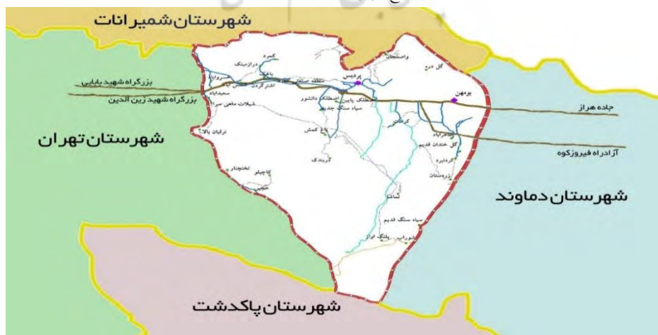
نقشه ۱. موقعیت محله شهر بومهن