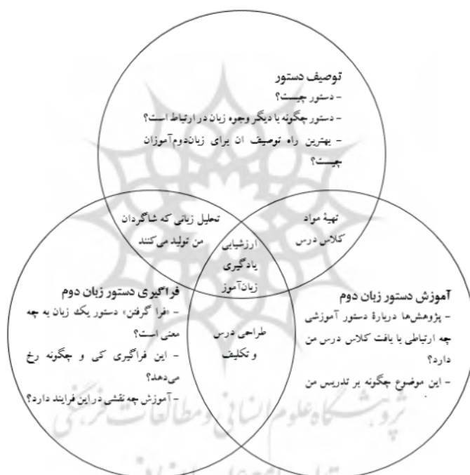
شکل (۲): چارچوبی برای آموزش دستور زبان دوم

دستور آموزشی نیز، به‌عنوان یکی از دستوره‌های مطرح در مبحث آموزش زبان، خود متشکل از چند حوزه درهم‌تنیده است و مؤلفه‌هایی چون تحلیل تولیدات زبانی زبان‌آموزان، ارزیابی میزان پیشرفت و یادگیری آنها، تهیه مواد مورد استفاده در کلاس درس و طراحی درس‌ها و تکلیف‌ها، در آن نقش‌های اصلی را ایفا می‌کنند.