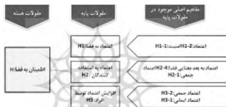
شکل ۱۱. اعتماد فضا

اعتماد به استفاده کنندگان فضا- نکته بسیار حائز اهمیت در چنین فضاهایی این است که استفاده کنندگان فضا از خلوص رفتاری موجود در افعال جمعی فضا مطمئن هستند. افراد به واسطه اینکه رفتار خویش را در فضا اصلاح می‌نمایند به رفتار اصلاح شده دیگر افراد نیز اعتماد متقابل دارند. اعتمادی که با تأکیدات آموزش محور فضا در استفاده کنندگان آن رسوخ کرده و نمود بیرونی و ماندگاری یافته است (H2-4) (H2-1). افزایش اعتماد - روند تکرار شونده آموزه‌های اخلاقی در کنار تکرار رفتارهای جمعی سبب شده است تا شمار گسترده‌ای از افراد در رده‌های سنی مختلف با معانی چنین فضاهایی آشنایی یابند. چنین ادراک نمادین و پر تواتری سبب حضور فضا و معانی آن در خاطره نسل‌های متممادی شده است. چنین برخوردی بستری سبب اعتماد جمعی و اعتماد معنایی را برای فضا نهادینه کرده است (H3-1) (H3-2). در نهایت مفاهیم و مقوله‌های مستخرج از داده‌های کیفی مطالعه بر