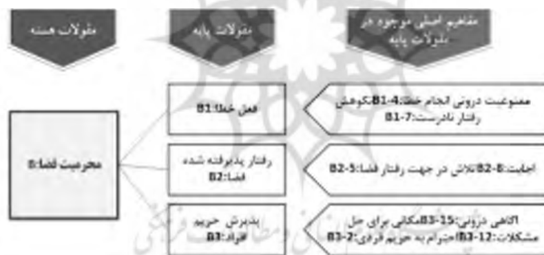
شکل ۵. مفهوم فضای

رفتار پذیرفته شده - باید توجه نمود که رفتار صالح در چنین فضاهایی چه از سوی افراد دیگر و چه از سوی بعد معنوی فضا دارای ارزش بوده و ترویج شده است (B1-5). چه اینکه در راستای رفتار