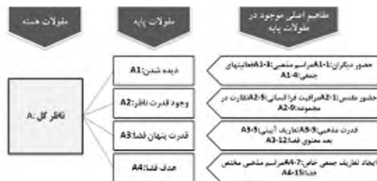
شکل ۴. ناظر کل