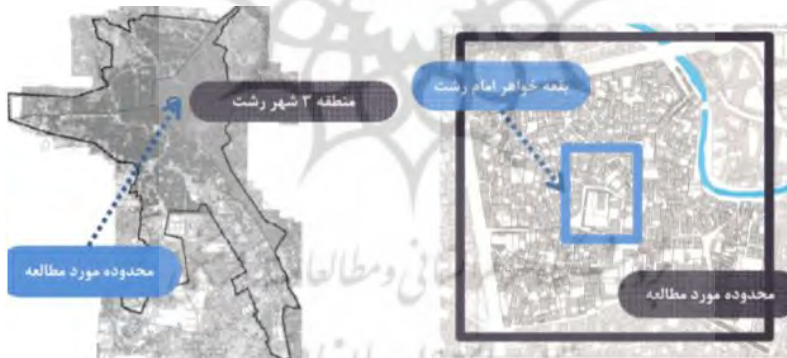
شکل ۲. موقعیت فضای شهری اطراف خواهر امام شهر رشت

در این تحقیق، دلایل حضور زنان در بقاع متبرکه در چند فضای شهری پیرامون بقاع متبرکه در استان گیلان مانند فضای شهری اطراف بقعه خواهر امام در شهر رشت، فضای شهری اطراف بقعه چهار پادشاه لاهیجان و ... مطالعه شد (اشکال ۲ و ۳) به ترتیب موقعیت فضاهای شهری پیرامون بقعه خواهر امام شهر رشت و اطراف بقعه چهار پادشاه لاهیجان را نشان می‌دهد. شیوه‌ی نمونه‌گیری مطالعه، نمونه‌گیری کیفی بوده است که به آن نمونه‌گیری هدفمند یا نمونه‌گیری نظری نیز می‌گویند. در این تحقیق از روش نمونه‌گیری گلوله برفی استفاده شده است حجم نمونه به اشباع نظری سؤال‌های مورد بررسی بستگی دارد. بر این اساس در بخش کیفی مطالعه با ۳۵ نفر از زنان ساکن در فضای شهری اطراف بقاع متبرکه مصاحبه عمیق انجام شد.