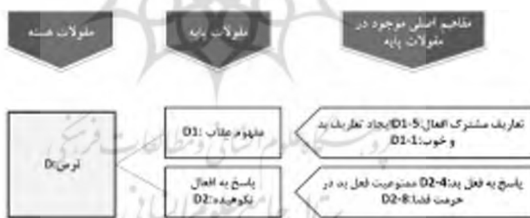
شکل ۷. ترس

شرط ایمان-ایمان و انتخاب حضور در چنین فضاها و زمان‌هایی کلید سهم برابر از معانی موجود در فضا است (C3-4). باید توجه نمود که شرط ایمان پذیرفته‌شده توسط استفاده‌کنندگان فضا هدف مشترکی برای حضور در فضا ایجاد نموده است. با چنین شرط مشترکی افراد با توجه به کنه ایمان خویش عضوی از تعاریف فضا خواهند بود (C3-1) (C3-10).