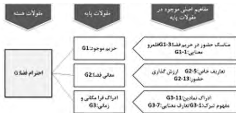
شکل ۱۰. احترام فضا