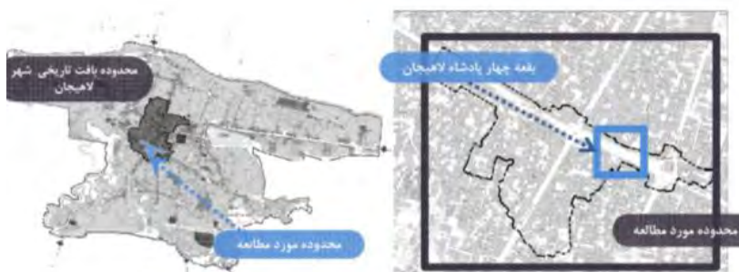
شکل ۳. موقعیت فضای شهری اطراف بقعه چهار پادشاه لاهیجان