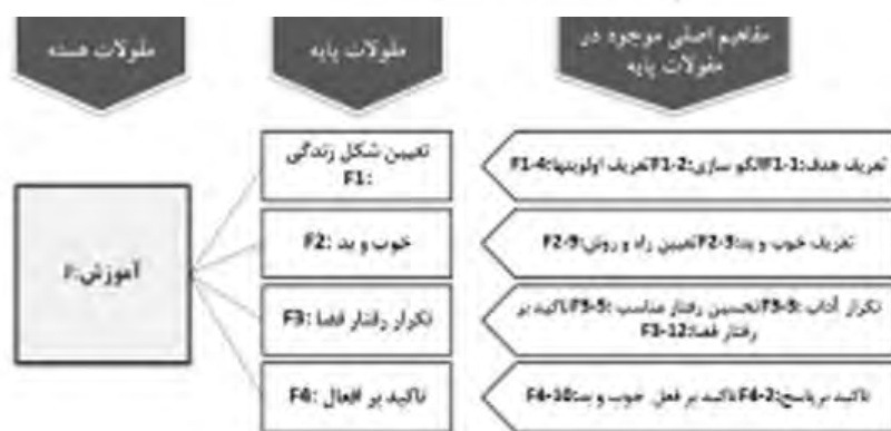
شکل ۹. آموزش

خوب و بد - باید توجه داشت که بعد معنایی و آموزشی چنین فضاهایی پس‌زمینه‌های رفتاری فضا را شکل داده‌اند. اینکه مهم‌ترین آموزش‌های ساختاری در روابط فردی و جمعی در چنین مناسک و