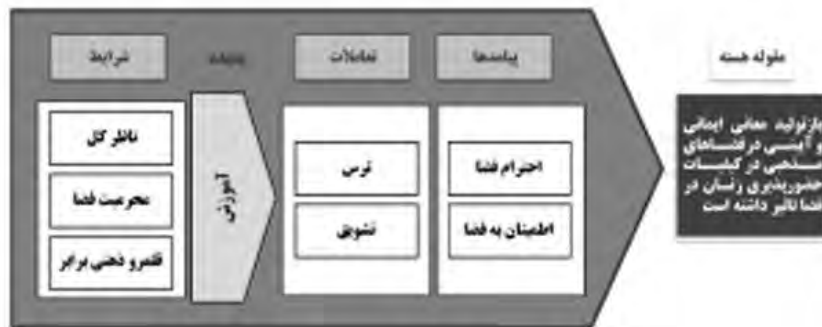
شکل ۱۲. نظریه نهایی تحقیق