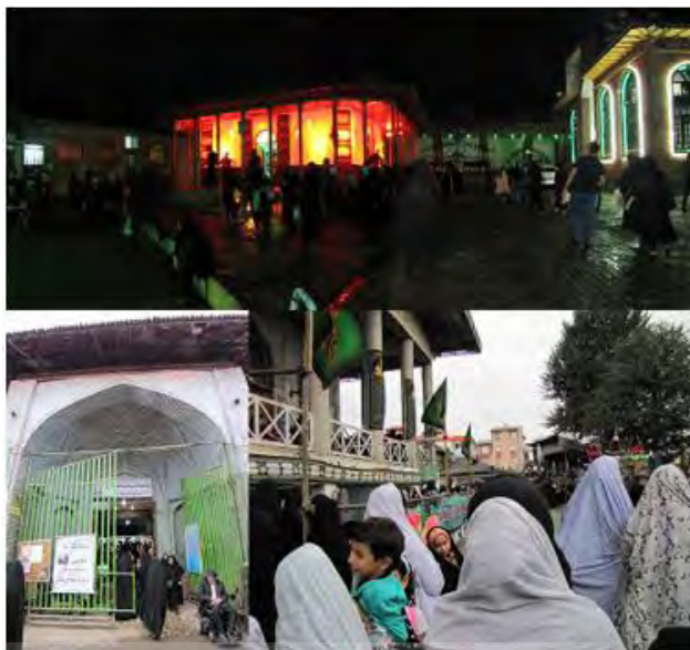
شکل ۱. حضور بانوان در فضاهای شهری پیرامون بقاع متبرکه

زنان از شهر و فضاهای شهری انجام شده است. باین وجود در خصوص موضوع تحت بررسی در این تحقیق تنها به چند مورد زیر اشاره می‌شود (جدول ۱):