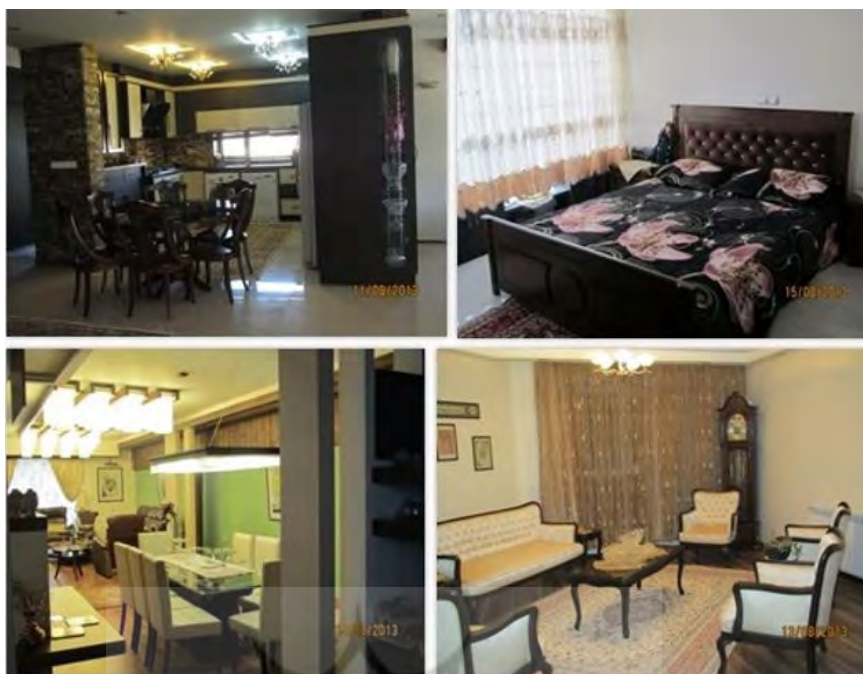
شکل ۲. نمونه‌هایی از وضعیت زندگی در فضاهای داخلی خانه، منطقه استادان

و مقایسه مفاهیم به‌دست‌آمده به تحلیل رابطه فضاهای معماری و فرهنگ مصرفی ساکنین خانه‌ها پرداخته است. جدول ۱ نشان‌دهنده تفاوت خانه‌ها در دو بافت از نظر فضاها، سبک مصرف و تعاریف متفاوتشان از فضاها و رفتارها می‌باشد.