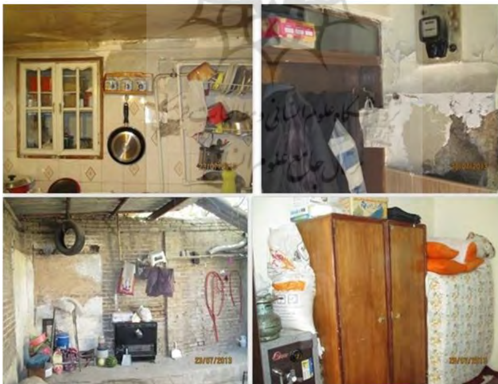
شکل ۱. نمونه‌هایی از وضعیت زندگی در فضای داخلی خانه، منطقه حاجی

که به ترتیب، مناطق حاجی و استادان هستند. در این پژوهش ۱۴ خانه در منطقه حاجی و ۱۳ خانه در منطقه استادان به‌عنوان نمونه در نظر گرفته شده است. البته نمونه اصلی ۱۰ مورد بوده است و به دلیل این‌که در این پژوهش از روش اشیاع نمونه استفاده شده است، چند مورد آخر، به‌عنوان مکمل نمونه محسوب می‌شوند؛ یعنی پژوهش به‌جایی می‌رسد که نمونه جدیدتری جهت مطالعه وجود ندارد و محقق به اشیاع نمونه رسیده است و داده‌ها روبه تکرار می‌روند. جهت تجزیه و تحلیل داده‌ها، داده‌های به‌دست‌آمده به روش توصیفی دسته‌بندی می‌شود و بعد از نشان دادن ابعاد موجود در مفاهیم، ابعاد و مفاهیم را به روش مقایسه‌ای شرح داده است. توصیفات، پایه «نظم دادن‌های مفهومی» حساب می‌شوند. «نظم دادن مفهومی عبارت است از سازمان دادن به داده‌ها در قالب دسته‌ها یا مقوله‌های مشخص (و گاه رتبه‌بندی شده) بر طبق ویژگی‌ها و ابعاد و سپس استفاده از توصیف برای باز کردن و توضیح دادن هر یک از آن دسته‌ها یا مقوله‌ها» (استراوس و کربین، ۱۳۹۰، ۴۰). پژوهشگر با استفاده از این داده‌ها، معنا را استخراج می‌کند. این روش این فرصت را به محقق می‌دهد که تمایزات و تشابهات موجود در گروه‌ها را نیز ببیند و بر اساس آن‌ها تحلیلی عمیق ارائه دهد و از سطح توصیف صرف عبور کند.