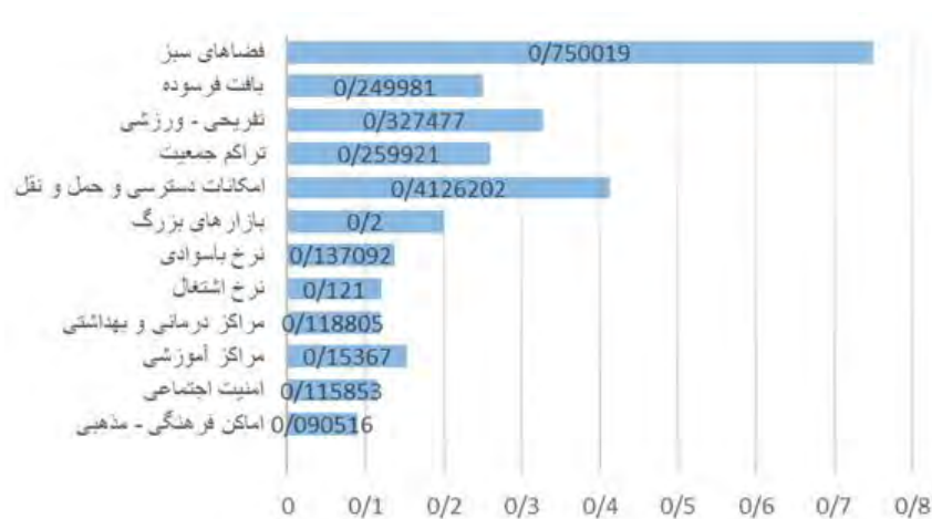
شکل ۲. نمودار اطلاعات نرخ ناسازگاری

و بالاخره مسئله درآمد برای همه آحاد شهر اشاره کرد. گونه شناسی آسیب‌های محلات منطقه یک که با استفاده از روش کتابخانه‌ای و مشاهده میدانی از نقطه-محل‌های مختلف نشان می‌دهد که در کل آسیب‌های اجتماعی به سه نوع اصلی تکدی‌گری، معتادان خیابانی و کارگران فصلی تقسیم می‌شوند. تکدی‌گری در نواحی ۱، ۲، ۳، ۷ و ۸ دیده می‌شود در نواحی مذکور نرخ بالای جمعیت و آمدوشدها و همچنین نزدیکی به مراکز تجاری و خرید از عوامل بروز این آسیب تشخیص داده شده است که اکثر تکدی‌گران این نقاط از شهروندان روستاهای حاشیه جنوبی شهر تهران و نواحی جنوبی آن واقع در مناطق حاشیه‌نشین و زاغه‌نشین است.