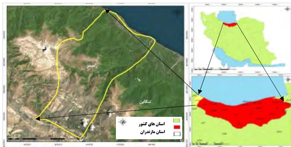
شکل ۱. موقعیت شهرستان رامسر در تقسیمات سیاسی کشور