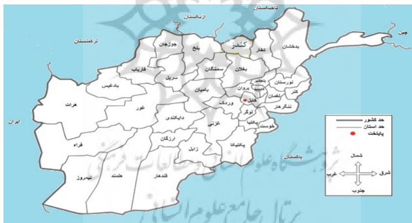
فصلنامه پژوهش‌های روستایی

از نظر سنی میانگین، انحراف معیار، کمینه و بیشینه سنی کارشناسان مورد مطالعه در این تحقیق به ترتیب، ۴۰/۶، ۱۱/۶، ۲۶ و ۶۲ سال بوده است. بر اساس همین نتایج، بیشترین فراوانی به دامنه سنی کمتر از ۳۶ سال تعلق داشت (جدول شماره ۱). همچنین اغلب پاسخگویان (۹۳/۳ درصد) را مردان تشکیل داده و تعداد زنان مورد مطالعه حدود هفت درصد بودند (جدول شماره ۲).