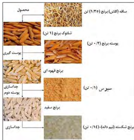
شکل ۱- تصویر محصولات مختلف به دست آمده در فرایند تولید برنج و نسبت محصولات فرعی آن