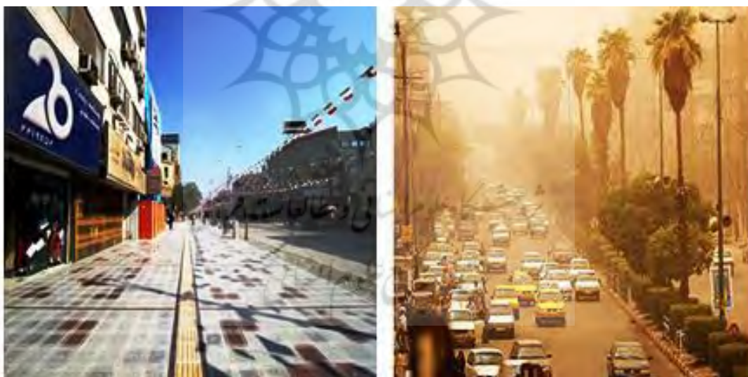
شکل ۳. خیابان نادری بعد از پیاده راه‌سازی

خیابان سلمان فارسی به عنوان اولین و مهم‌ترین خیابان کلانشهر اهواز که تا قبل از پیاده راه‌سازی محور متراکم‌ترین و پرتراکم‌ترین خیابان محسوب می‌شد روزانه حجم زیادی از وسائط نقلیه را به سمت خود می‌کشاند. شکل‌های ۲ و ۳ قبل و بعد از پیاده راه‌سازی خیابان نادری شهر اهواز را نشان می‌دهد.