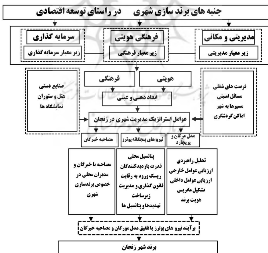
شکل شماره ۱. مدل مفهومی پژوهش

در شهر زنجان در حال حاضر برند شهری پایتخت شور و شعور حسینی به‌عنوان برند شهری معرفی شده است که می‌توان آن را به‌عنوان یک برند ناموفق در نظر گرفت. ناموفق بودن برند کنونی شهر زنجان به دلایل متعددی است که مهم‌ترین آن را می‌توان عدم مطالعه و مبتنی بر زیرساخت‌های علمی بودن آن است. از سوی دیگر طبق تعاریف برند سازی شهری، برند یک شهر نباید محدود به مکان و زمان خاص باشد. برند شهر زنجان مختص ایام محرم بوده و لزوماً در ایام محرم رخ می‌دهد. از این سو مطالعات برند سازی شهری و بررسی اصول آن را می‌توان راه‌حل برون یافت از این سردرگمی دانست.