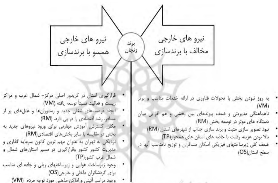
شکل شماره ۳. برآیند ارزیابی عوامل خارجی

در این جدول نیروهای خارجی، که بر هویت بارز شهر زنجان (جاذبه‌های طبیعی و تاریخی) تأثیر می‌گذارند، در قالب نیروهای پوترز فهرست شده‌اند. سپس با توجه به میزان اهمیت و حساسیت هر عامل، با مقایسه این عوامل با یکدیگر ضریب اهمیتی بین صفر تا یک به عامل‌ها تعلق می‌گیرد. نیروهای خارجی ممکن است همسو باهدف برند سازی عمل کنند و یا در خلاف و مقابله با آن نقش آفرینی کنند. وزن دهی به عوامل و نیروهای خارجی از پرسشنامه خبرگان برآیند شده است.