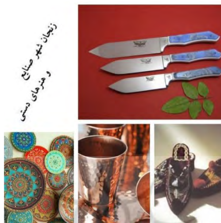
شکل شماره ۵. نشان برند شهر زنجان

مورگان و ریچارد (۲۰۰۴:۱۴) اظهار می‌دارند که در این مرحله، هویت بارز برند در قالب عنوان و نشان برند شهر به ذینفعان ارائه می‌شود. بنا بر نظر ایشان، ارائه برند به ذی‌نفعان در کنار تبلیغات برای برند اهمیت بسیاری دارد. در پژوهش حاضر، پس از گزینش و ارائه عنوان برند شهر زنجان، با استفاده از نظر متخصصان حوزه بازاریابی و طراحی لوگو، نشان شهر زنجان ارائه شده است (شکل ۵). در ارائه نشان برند حاضر سعی شده هویت فرهنگی و تاریخی شهر زنجان، که در مراحل قبلی پژوهش تشریح شده، نمود یابد.