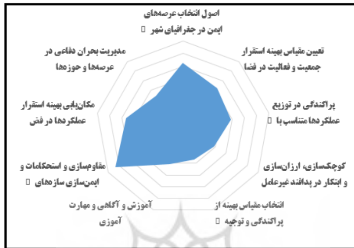
شکل ۴. میزان انطباق اصول پدافند غیرعامل با شهر قرچک

مطابق نتایج به دست آمده در اصول انتخاب عرصه‌های ایمن در جغرافیای شهر قرچک (بالاترین رتبه متعلق به اقدام ارزیابی نواحی آسیب پذیر شهر نسبت به تهدید)، در اصول تعیین مقیاس بهینه استقرار جمعیت و فعالیت در فضا نیز (بالاترین رتبه متعلق به اقدام ایجاد مطلوب ترین میزان جمعیت و یا فعالیت مستقر در یک موقعیت)، در اصول پراکندگی در توزیع عملکردها متناسب با تهدیدات و جغرافیای شهر قرچک نیز (بالاترین رتبه متعلق به اقدام آنالیز و بررسی انواع عملکردها و کارکردها در هر سیستم و پروژه) و در اصول کوچک‌سازی، ارزان‌سازی و ابتکار در پدافند غیرعامل نیز، (بالاترین رتبه متعلق به اقدام جلوگیری از افزایش هزینه‌های اجرائی در اجرای طرح‌ها)، در اصول انتخاب مقیاس بهینه از پراکندگی و توجیه اقتصادی پروژه‌ها (بالاترین رتبه متعلق به اقدام تعریف و درجه‌بندی میزان امنیت برای هر طرح در برابر تهدید)، همچنین در اصول آموزش و آگاهی و مهارت آموزشی (بالاترین رتبه متعلق به اقدام بهره‌گیری از انواع روش‌های آموزش و یادگیری شامل کتب، بروشور، کلاس‌های تخصصی)، در اصول مقاوم‌سازی و استحکامات و ایمن‌سازی سازه‌های حیاتی (بالاترین رتبه متعلق به اقدام تعیین میزان ایمنی هر سیستم در برابر تهدید و درجه‌بندی آنها)، در اصول مکان‌یابی بهینه استقرار عملکردها در فضا (بالاترین رتبه متعلق به اقدام استفاده از استانداردهای فنی مقاوم در سازه‌های حیاتی و حساس) در نهایت، اصول مدیریت بحران دفاعی در عرصه‌ها و حوزه‌ها (بالاترین رتبه متعلق به اقدام مدیریت بحران به منظور مدیریت بر حوادث، تبعات)، می‌باشد.