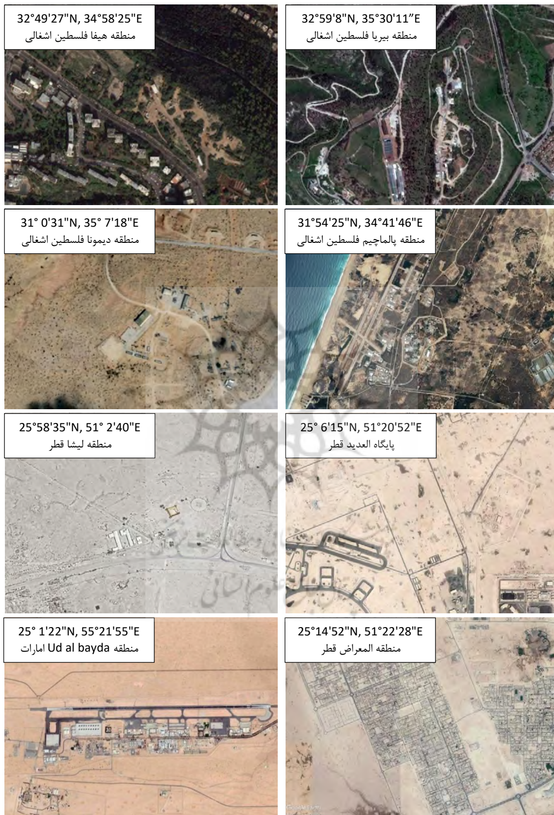
ادامه شکل ۵: سامانه‌های پاتریوت فعال در اطراف ایران و موقعیت جغرافیایی آن‌ها