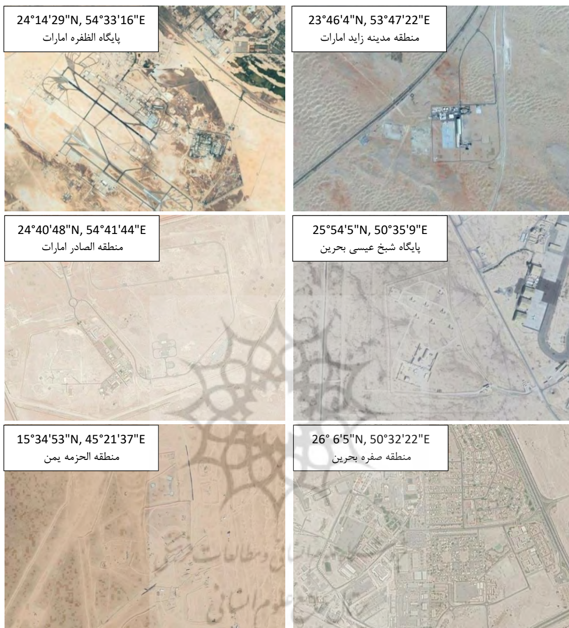
ادامه شکل ۵: سامانه‌های پاتریوت فعال در اطراف ایران و موقعیت جغرافیایی آن‌ها

از طرف دیگر، همان‌گونه که ذکر شد، بایستی حتماً یک بازه زمانی برای تصاویر در نظر گرفته شود؛ چرا که ۲ تصویر از هر نقطه برای تحلیل مورد نیاز است. در این حالت، در صورتی که سامانه‌ای برای مدتی غیرفعال نیز شود، باز هم در نتایج نمایش داده می‌شود.