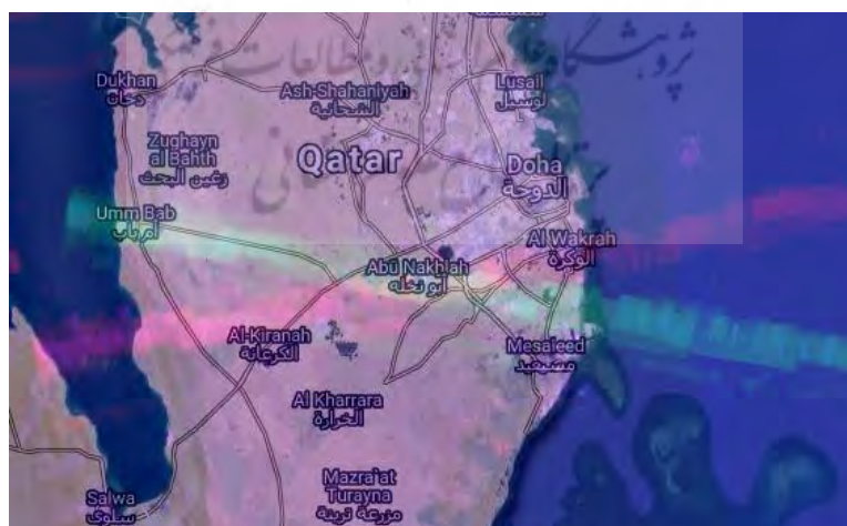
شکل ۲: خطوط ظاهر شده بر اثر ترکیب دو قطبیدگی VH و VV در کشور قطر

مطابق الگوریتم ذکر شده، با نمایش ترکیبی قطب‌های VH و VV در این تصاویر، خطوط X ماندنی ظاهر می‌شوند که عمدتاً در حوزه خلیج فارس نیز تمرکز بیشتری دارند. نمونه‌ای از این نتیجه در شکل ۲ نشان داده شده است. برای مثال، با جستجوی دقیق خطوط قابل مشاهده در شکل ۲،