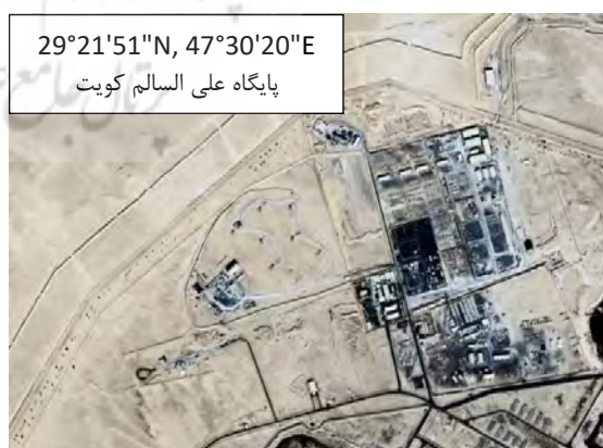
شکل ۵: سامانه‌های پاتریوت فعال در اطراف ایران و موقعیت جغرافیایی آن‌ها