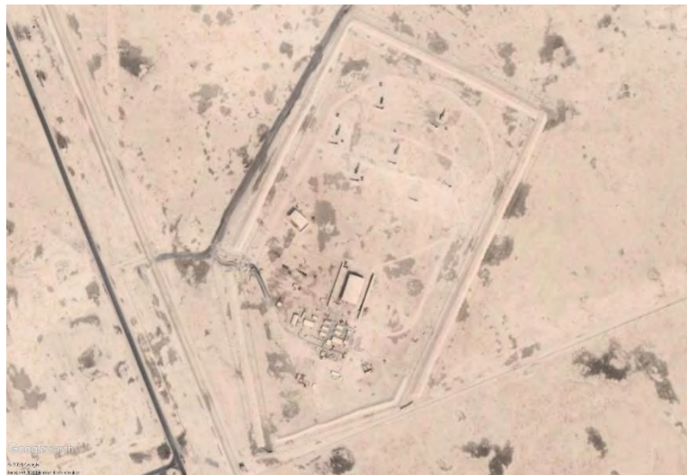
شکل ۳: شناسایی سامانه پاتریوت واقع در پایگاه العدید قطر

امارات با ۴ سامانه شناسایی شده، بیشترین تعداد را داراست که این سامانه‌ها در شمال این کشور تراکم بیشتری دارند. معروف‌ترین سامانه فعال در امارات متعلق به پایگاه نظامی الظفره است که محل استقرار نظامیان آمریکایی است. از طرف دیگر کشور قطر قرار دارد که با وجود مساحت اندک آن، دارای ۳ سامانه فعال است که البته بررسی‌ها نشان داد که همه این سامانه‌ها در حال حاضر فعال نیستند و به صورت دوره‌ای غیرفعال می‌شوند. مشهورترین سامانه این کشور نیز مربوط به پایگاه نظامی العدید بوده که آن نیز متعلق به نظامیان آمریکایی است. همچنین سامانه فعال در دوحه نیز در سال‌های اخیر در این محل استقرار یافته است. از سویی دیگر، کشور کوچک بحرین نیز در حال حاضر دو سامانه فعال در اختیار دارد که معروف‌ترین آن‌ها در پایگاه نظامی شیخ عیسی قرار دارد که مربوط به نظامیان آمریکایی و تجهیزات مربوط به آن‌هاست. همچنین دو کشور کویت و اردن نیز هرکدام ۱ سامانه فعال در اختیار دارند که به ترتیب مربوط به پایگاه علی السالم و شهید موفق است که هر دو این‌ها هم متعلق به نظامیان آمریکایی است.