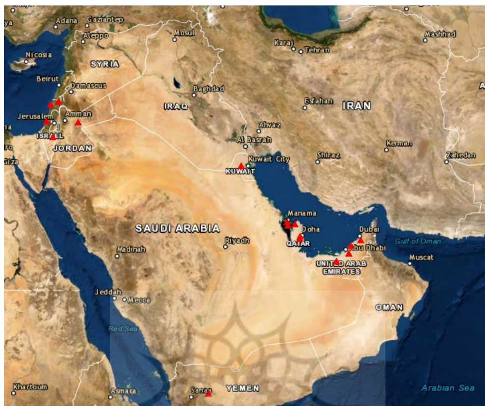
شکل ۴: سامانه‌های پاتریوت فعال در اطراف ایران به جز کشور عربستان

مساحت اندک دارای ۴ سامانه فعال هستند که در جای جای آن قرار گرفته است. تمامی این سامانه‌ها و مختصات قرارگیری آن‌ها در شکل ۵ نمایش داده شده است.