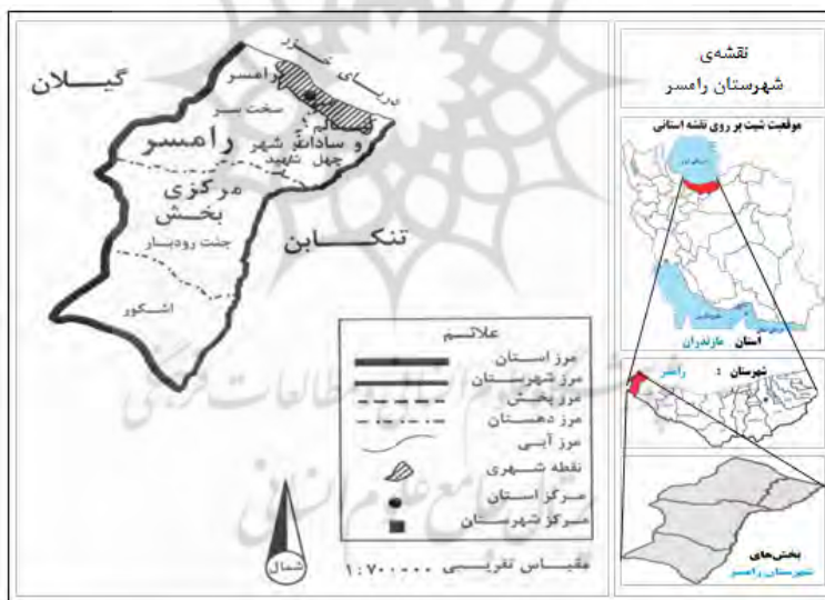
شکل شماره ۲. نقشه موقعیت جغرافیایی رامسر

شهرستان رامسر در منتهی‌الیه غرب استان مازندران در شمال ایران و در کرانه جنوبی دریای خزر واقع می‌باشد و کل مساحت آن ۶۸۸ کیلومتر با وسعت ۷۲۹/۸ کیلومترمربع است که حدود ۳/۱ در صد از کل مساحت استان را به خود اختصاص داده است. این شهر در عرض جغرافیایی ۳۶ درجه و ۴۹ دقیقه تا ۳۶ درجه و ۵۷ دقیقه شمال و طول جغرافیایی ۵۰ درجه و ۳۸ دقیقه تا ۵۰ درجه و ۴۴ دقیقه شرقی قرار دارد و ارتفاع تقریبی آن از سطح آب‌های آزاد ۲۰ متر می‌باشد (مشیری و فتح‌اللهی، ۱۳۸۹: ۶۴). رامسر به دلیل برخورداری از ویژگی‌های آب‌وهوایی، چشم‌اندازهای گوناگون و دو آبر جاذبه جنگل و دریا از ادوار قبلی بسیار موردتوجه قرار داشته است، به طوری که زیباسازی شهر رامسر در سال ۱۳۴۲ آغاز گردید و لقب "عروس شهرهای ایران" را به آن داده‌اند (محمدی و همکاران، ۱۳۹۸: ۱۹). علاوه بر این، شهر رامسر دارای ویژگی‌ها و جاذبه‌های گردشگری دیگری در حوزه شهری خود شامل دسترسی بالای شهری و پیرامونی به تأسیسات و جاذبه‌ها، فرودگاه بین‌المللی، اماکن اقامتی برجسته، رستوران‌های شهیر با گستره‌ای از خوراکی‌های محلی، مراکز تفریحی - سرگرمی و بازدید، مسیرهای پیاده منظر گردی در روز و شب، برگزاری رویدادهای میراث معنوی دارای شماره ثبت ملی، مراکز گردشگری پیشگیرانه چشمه‌های آبگرم و معدنی، جنگل‌ها و باغ شهری ۳۳ هکتاری می‌باشد. همچنین شهرستان رامسر، گردشگر پذیرترین شهر در استان مازندران (محمدی و میرتقیان‌رودسری، ۱۳۹۸: ۱۵۲).