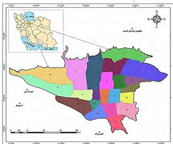
شکل شماره ۱. محدوده مورد مطالعه

شهر تهران با وسعتی بالغ بر ۷۳۰ کیلومترمربع بین ۳۵ درجه و ۳۴ دقیقه تا ۳۵ درجه و ۵۹ دقیقه عرض شمالی، و ۵۱ درجه و ۵ دقیقه تا ۵۱ درجه و ۵۳ دقیقه طول شرقی قرار دارد. ارتفاعات جنوبی البرز مرکزی، نواحی شمال و شمال شرقی تهران را در بر گرفته است. از سمت غرب، دشت ساوجبلاغ و از جنوب کوه‌های منطقه ری و بی‌بی شهربانو و دشت‌های منتهی به کویر نمک، این شهر را محصور کرده‌اند. این شهر به ۲۲ منطقه شهری تقسیم شده است و مساحت آن بدون احتساب حریم شهری حدود ۶۱۵ کیلومترمربع، و با احتساب حریم شهری به ۷۳۰ کیلومترمربع می‌رسد. همچنین از نظر تقسیمات اداری به ۲۲ منطقه، ۱۲۳ ناحیه و ۳۵۳ محله تقسیم می‌شود. وسیع‌ترین منطقه شهری تهران، منطقه ۴ با ۶۱ کیلومترمربع و پس از آن منطقه ۲۲ با ۵۹ کیلومترمربع است. شهر تهران بیشترین تعداد سینماهای کشور را به خود اختصاص داده و در سال ۹۸ در این شهر ۵۶ سینما با گنجایش ۴۰۰۶۹ نفر وجود داشته است. همچنین در این شهرسالانه رویدادها و جشنواره‌های سینمایی متعددی برگزار می‌شود که از این میان می‌توان به جشنواره فیلم فجر، جشنواره فیلم فجر بخش بین‌الملل و جشنواره بین‌المللی فیلم کوتاه تهران اشاره نمود (رحیمی و توسلی، ۱۳۹۸: ۵۸).