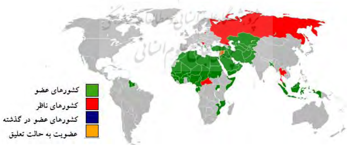
شکل ۳. کشورهای عضو سازمان همکاری اسلامی

محدوده مورد مطالعه شهر مشهد، واقع در شمال شرق ایران و در استان خراسان رضوی، به عنوان یکی از شهرهای با اهمیت در بین شهرهای مذهبی کشورهای اسلامی، می‌باشد. کشورهای اسلامی را به سه گونه تقسیم بندی نموده‌اند: کشورهای با بیش از ۷۵ درصد جمعیت مسلمان، کشورهای با ۵۰ درصد جمعیت مسلمان و کشورهای اعضای سازمان کنفرانس اسلامی (احمدیان، ۱۳۸۵، ص. ۹). در این پژوهش کشورهای اسلامی به معنای گسترده آن در نظر گرفته شده است که همان کشورهای عضو سازمان همکاری اسلامی (۵۷ کشور) می‌باشد که شکل ۱ این کشورها را نشان می‌دهد.