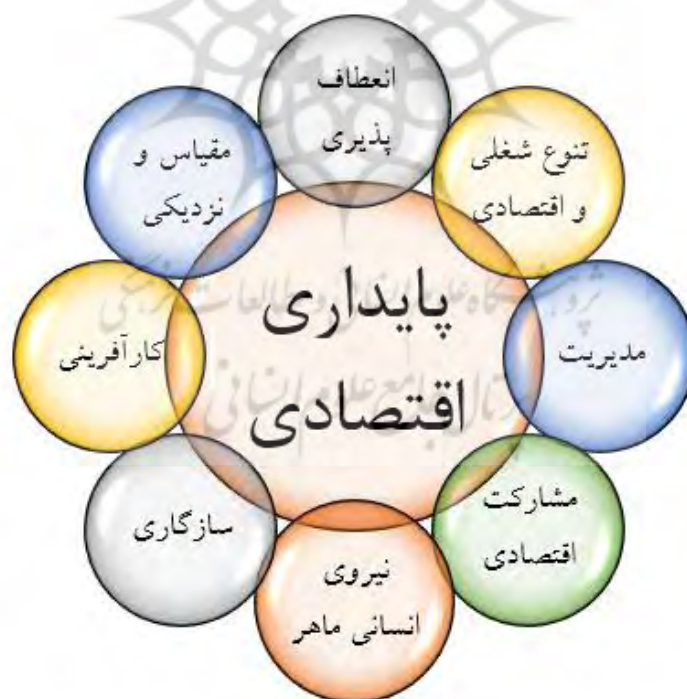
شکل ۱. ابعاد پایداری اقتصادی

مقیاس و نزدیکی: بسیاری از اقتصاددانان از صرفه‌های مقیاس به‌عنوان ملاک عملی برای تشخیص درجه رقابت یا انحصاری بودن بازارها استفاده می‌کنند (خداداد کاشی، ۱۳۸۶، ص.۱). مشارکت اقتصادی: امروزه مشارکت به‌عنوان رهیافتی کارآمد، نقش مهمی در دستیابی به معیشت پایدار و برقراری نظام پایدار اقتصادی در جوامع ایفا می‌کند. در واقع رهیافت مشارکت با فراهم آوردن بستر همکاری و ایجاد جریان اطلاعاتی در بخش‌های مختلف تولید، خدمات و بازرگانی، زمینه مناسبی را جهت استمرار و پایداری نظام اقتصاد جوامع به‌وجود می‌آورد (شایان و همکاران: ۱۳۹۱، ص.۹۵). تغییر و تحول (انعطاف‌پذیری): در پایان قرن بیستم تولید انعطاف‌پذیر جای خود را به تولید انبوه داده است. در عصر کنونی با تغییر شیوه‌های تولید، چهره زندگی دگرگون خواهد شد. تولید انعطاف‌پذیر فلسفه‌ای متفاوت دارد که در آن رابطه بین قیمت، تعداد، کیفیت و سود برقرار می‌گردد که با تفکرات گذشته متفاوت است. گفته می‌شود مشکل کمبود زمین یکی از دلایل شکل‌گیری سیستم تولید انعطاف‌پذیر است. توانایی خلق مزیت نسبی و رقابتی در محیط پویا و پر تحول صنعت امروزی یک ارزش است. تولید انعطاف‌پذیر سیاست نسبتاً جدیدی است که توسط شرکت‌های موفق برای توسعه و افزایش رقابت به کار گرفته می‌شود (فرهمند و همکاران، ۱۳۹۳، ص.۴).