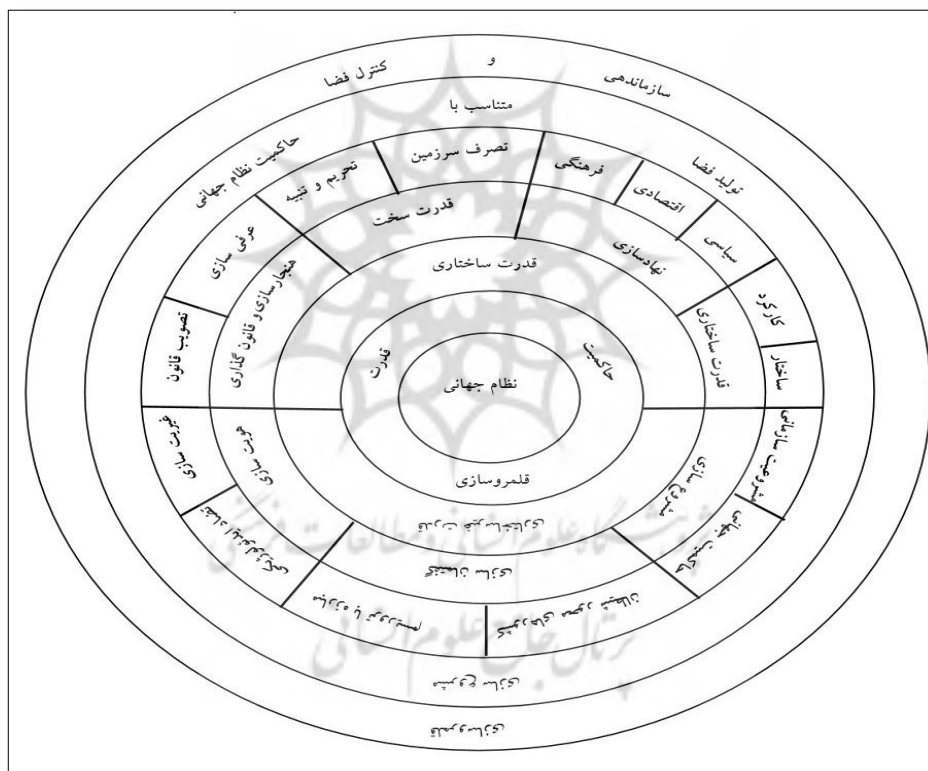
ترسیم از: (نگارندگان)

گفتمان‌سازی، هویت‌سازی و غیریت‌سازی از جمله عناصری می‌باشند که زمینه مشروعیت حاکمیت جهانی را فراهم می‌نمایند. هدف نهایی نظام جهانی از به کارگیری عناصر ساختاری و غیرساختاری سازماندهی سیاسی فضا و در نهایت قلمروسازی می‌باشد. در واقع قدرت با عناصر ساختاری و غیرساختاری زمینه حاکمیت نظام جهانی را فراهم می‌نماید. و این حاکمیت منجر به تولید مشروعیت جهت سازماندهی سیاسی فضا و قلمروسازی نظام جهانی می‌گردد. بی‌شک نقش نهادها و سازمان‌ها در سازماندهی سیاسی فضا غیرقابل انکار می‌باشد. سازمان ملل در رأس این نهادها می‌باشد. نهادهای امروزی که محصول دوران پس از جنگ جهانی دوم می‌باشند نقش مهمی در تولید فضا متناسب با اهداف و منافع نظام جهانی در سطح