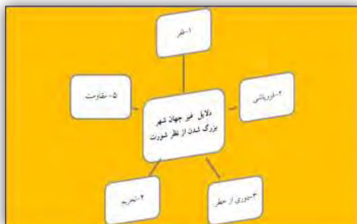
شکل ۲. دلایل غیر جهان شهر بودن از نظر شورت

بنابراین، جایگاه غیرجهان شهری تا حد زیادی بازتاب فقر است. برخی شهرها، به‌رغم اندازه‌شان، چنان فقیرند که بازاری برای خدمات تولیدگر پیشرفته عرضه نمی‌کنند. آن‌ها، با توجه به جمعیت بسیار زیاد، اما نبود مصرف‌کنندگان مرفه یا مجموعه‌های صنعتی برای پشتیبانی از خدمات تولیدگر پیچیده سیاه‌چاله‌های سرمایه‌داری پیشرفته جهانی‌اند. بنا بر تعریف بانک جهانی، هشت شهر از یازده شهر (جدول ۳) در کشورهایی با درآمد پایین و سه شهر (تهران، بغداد، و الجزیره) در مقوله درآمد پایین تا متوسط قرار دارند. بانک جهانی کشورها را بر اساس درآمد سرانه ناخالص ملی در چهار مقوله رده‌بندی می‌کند: پایین، پایین تا متوسط، بالاتر از متوسط و بالا. همگی شهرهای این جدول در دو مقوله پایینی‌اند. ارزش‌های مطلق ۱ سرانه درآمد ناخالص ملی در جدول ۴ نشان داده شده است. این شهرها در برخی از فقیرترین کشورهای جهان قرار دارند. کینشازا پایتخت کنگویی است که سرانه درآمد ناخالص ملی آن در سال ۲۰۰۰ رقم رقت‌انگیز ۱۱۰ دلار بود.