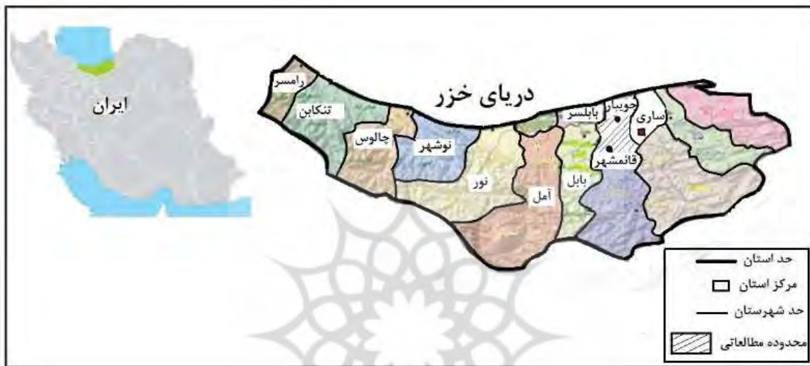
شکل شماره ۱. موقعیت شهر قائم‌شهر

شهر قائم‌شهر با مساحتی معادل ۷۴۰ کیلومتر مربع در قسمت مرکزی استان مازندران قرار دارد و مرکز شهرستان قائم‌شهر می‌باشد (شکل ۱). قائم‌شهر یکی از پرتراکم‌ترین شهرهای مازندران است. قائم‌شهر در مسیر راه اصلی ساری - آمل قرار گرفته است و از طریق جاده فیروزکوه به تهران متصل می‌شود و تا تهران ۲۵۷ کیلومتر فاصله دارد (Part Architect and Urban Planning Consulting Engineers: 2006). جمعیت شهر قائم‌شهر برابر با ۲۳۰۵۵ نفر و در سال ۱۳۹۵ جمعیت شهر قائم‌شهر برابر ۲۰۴۹۵۳ نفر می‌باشد (Statistics Center of Iran: 2016). شهر قائم‌شهر به سه منطقه شهری با ۲۰ محله تقسیم شده است.