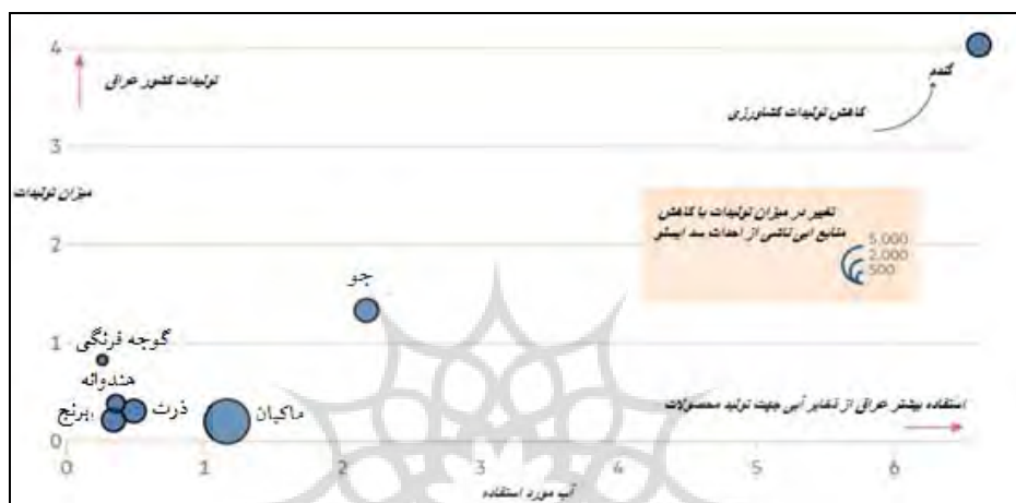
شکل ۲. کاهش آب مورد نیاز ناشی از سد ایلیسو برای کشت محصولات در کشور عراق

از بارش باران و ذوب برف تا سال ۲۰۳۰ به میزان ۲۵ درصد کاهش یابد و این روند با توجه به احداث سد ایلیسو بر روی رود دجله کشاورزی ایران را با بحران روبرو سازد (دلین، ۲۰۱۹، ص. ۱).