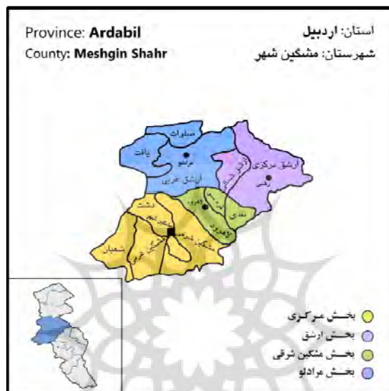
شکل ۲. موقعیت سیاسی شهرستان مشگین شهر

اکوتوریسم مشگین شهر شده، چشمه آبگرم قینرجه می‌باشد که به داغ‌ترین چشمه‌ی آبگرم جهان نیز مشهور بوده و در دامنه کوه سبلان واقع شده است (سازمان گردشگری و میراث فرهنگی شهرستان مشگین شهر، ۱۳۹۹) (شکل ۲).