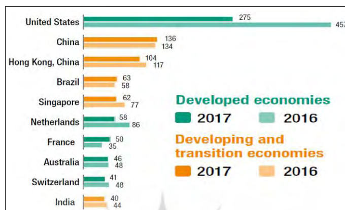
شکل (۴): نمودار ده کشور برتر در جذب سرمایه خارجی