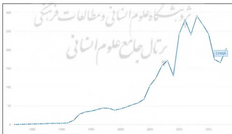
شکل (۵): نمودار روند رشد سرمایه‌گذاری خارجی در چین

بانک جهانی میزان جذب سرمایه خارجی چین در سال ۲۰۱۷ و ۲۰۱۸ را به ترتیب ۱۶۶/۰۸۴ و ۲۰۳/۴۹۲ میلیارد دلار اعلام کرده است (World Bank, 2018b). اگرچه این آمار با ۱۳۶ و ۱۳۴ میلیارد دلار ارائه شده توسط آنکتاد تفاوت دارد اما در هر حال چین بعد از ایالات متحده در رتبه دوم جذب سرمایه‌گذاری مستقیم خارجی قرار دارد. شکل (۵) نمودار رشد سرمایه‌گذاری مستقیم خارجی را در چین از ۱۹۸۲ تا ۲۰۱۸ نشان می‌دهد.