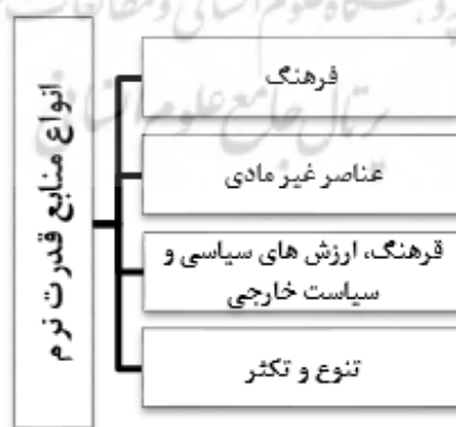
شکل (۳): نمودار طبقه‌بندی منابع قدرت نرم از منظر اندیشمندان

خود یا سایر کشورها پرداخته‌اند. اما مروری اجمالی بر آثار جوزف نای و سایر محققانی که در این زمینه به قلم‌فرسایی مشغول بوده‌اند؛ بیانگر تنوع و تمایز دیدگاه‌ها و اندیشه‌ها درباره منابع قدرت نرم می‌باشد. در عین حال تا زمانی که تصویر روشن و جامعی از منابع قدرت نرم نباشد، نمی‌توان به درستی در مورد ماهیت قدرت نرم قضاوت کرد به همین منظور شناخت و آگاهی از دیدگاه اندیشمندان در مورد منابع قدرت نرم از اهمیت وافری برخوردار است در همین زمینه مروری بر آثار اندیشمندان مختص در حوزه قدرت نرم نشان می‌دهد که حداقل چهار دیدگاه کلی در مورد منابع قدرت نرم وجود دارد: گروه اول کسانی هستند که از فرهنگ به عنوان منبع اصلی قدرت نرم یاد می‌کند و در کل این قدرت را معادل قدرت فرهنگی تلقی می‌کنند (Qanbarloo,2011:14). گروه دوم محققانی را در بر می‌گیرد که معتقدند منابع قدرت نرم معادل عناصر معنوی قدرت از قبیل روحیه، مذهب، رهبری، فرهنگ و... می‌شود. گروه سوم نیز افرادی را در بر می‌گیرد که به پیروی از دیدگاه نخست جوزف نای، منابع قدرت نرم را در سه مولفه کلی از جمله فرهنگ، ارزش‌ها و سیاست داخلی و سیاست خارجی طبقه‌بندی می‌کنند و متاثر از این چارچوب نظری به معرفی منابع قدرت نرم کشورها اهتمام می‌ورزند. اما گروهی دیگر نیز وجود دارد که بر خلاف سایر دیدگاه‌های علمی معتقدند که منابع قدرت نرم بسیار متنوع و تغییرپذیرند.