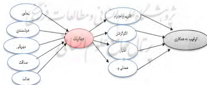
شکل (۲): نمودار فرآیند ترجمه جذابیت در قدرت نرم