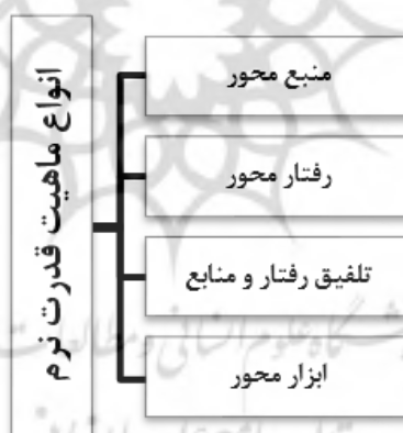
شکل (۱): نمودار طبقه‌بندی ماهیت قدرت نرم از منظر اندیشمندان

بدون زور و واداشتن دیگران به خواسته‌های خود می‌باشد (Mirzaei,2015:63). ویلیما سینجین ۱ نیز معتقد است که قدرت نرم قدرت جذابی است و منابع آن دارایی‌هایی هستند که چنین جذاییتی را ایجاد می‌کنند (Cingiene and et al,2014:3). عبدالله قنبرلو نیز اشاره دارد که قدرت نرم، قدرتی است که با استفاده از آن باعث می‌شویم دیگران از روی رضایت مطابق خواست ما رفتار کنند. به عبارت دیگر، با استفاده از قدرت نرم بر گزینه‌ها یا ترجیحات طرف مقابل نفوذ می‌کنیم و آن‌ها را مطابق میل خود تغییر می‌دهیم (Qanbarloo,2011:10). سمیعی اصفهانی و فتحی نیز معتقدند که قدرت نرم به معنای توانایی دستیابی به اهداف مطلوب از طریق جلب حمایت افکار عمومی و نخبگان و اقناع اذهان به جای اعمال فشار است؛ ضمن اینکه این بعد از قدرت از منابع فرهنگ، عقاید، باورها و آداب و سنن اجتماعی نشأت می‌گیرد (Mousavi Jashni,2014:163).