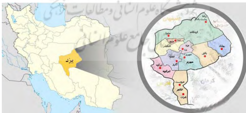
شکل ۱. منطقه مورد مطالعه

استان یزد با مساحت تقریبی ۷۴۷۸۱ کیلومتر مربع در قسمت مرکزی فلات ایران قرار دارد (شکل ۱). به دلیل موقعیت جغرافیایی استان، آب‌وهوای غالب آن گرم و خشک است. متوسط بارندگی سالیانه استان ۱۰۰ میلی‌متر است (متوسط بارندگی سالیانه کشور ۲۵۰ میلی‌متر است). بر اساس آخرین تقسیمات کشوری، استان یزد ده شهرستان دارد و شهرستان یزد مرکز این استان است. بر اساس نتایج سرشماری جمعیت استان یزد در سال ۱۳۹۵ یک میلیون و ۱۳۸ هزار نفر بوده است که حدود ۱/۴ درصد از جمعیت کشور را در خود جای داده و میان ۳۱ استان رتبه ۲۴ را دارد.