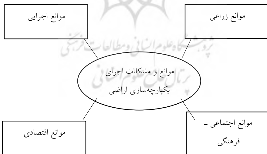
شکل ۱- مدل مفهومی موانع و مشکلات یکپارچه سازی اراضی

نتایج پژوهش نشان داد از جمله عوامل اقتصادی که مانع از اجرای طرح یکپارچه سازی شده بود، دو زیر مقوله ۱- نبود تسهیلات (عدم دریافت بودجه برای تجهیز زمین ها)، ۲- مشکلات مالی (هزینه بالای یکپارچه سازی، ترس از ریسک به دلیل شرایط بد اقتصادی) بوده است که جمشیدی و همکاران (۱۳۸۸)، کریمی و همکاران (۱۳۹۷)، (Demetriou et al., 2012)، (Perfecto & Vandermeer, 2010) نیز به هزینه بالای اجرای طرح در مطالعات خود اشاره کرده اند. مسلماً طرح یکپارچه سازی اراضی نیازمند منابع مالی است بنابراین، اعطای تسهیلات می تواند مشوقی برای یکپارچه سازی اراضی باشد که در این راستا حمایت های مالی دولت، شرکت های خصوصی مؤثر هست.