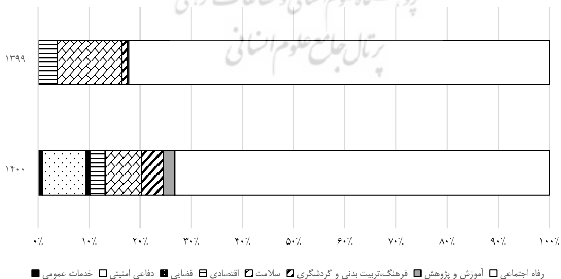
نمودار ۱: نسبت اعتبارات یارانه‌ای امور مختلف ۱۳۹۹-۱۴۰۰

نمودار زیر سهم اعتبارات یارانه‌ای در حوزه‌های مختلف را نشان می‌دهد. مطابق قانون بودجه ۱۳۹۹ و ۱۴۰۰، حوزه رفاه اجتماعی از سهم ۸۲.۱۳ درصد به ۷۳.۴ درصد کاهش یافته است. پس از آن حوزه سلامت در سال ۱۳۹۹ و حوزه دفاعی امنیتی در سال ۱۴۰۰ به ترتیب با سهم ۱۲.۶ درصد و ۸.۵ درصد بیشترین سهم را به خود اختصاص داده‌اند.