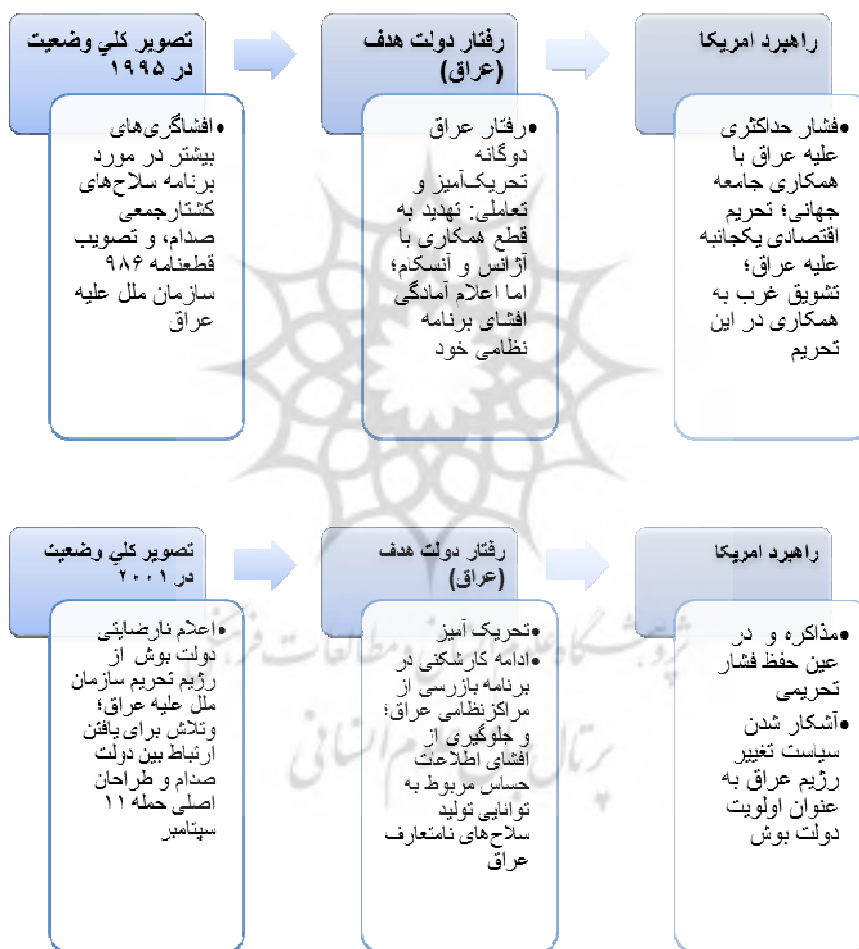
نمودار ۲. رویدادهای مهم در روابط آمریکا و عراق، ۱۹۹۵-۲۰۰۱