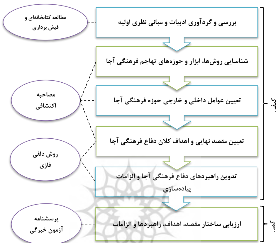
شکل (۱) فرایند اجرای تحقیق

در این تحقیق جهت تدوین راهبردها، از روش تدوین راهبرد مقصد-هدف-راهبرد (GOS) استفاده شده است. در این روش مقاصد (Goal)، اهداف (Objectives) و راهبردها (Strategy) همانند یک درخت با ساختاری سلسله مراتبی تعریف می‌شوند به این معنی که مقاصد توسط مجموعه‌ای از اهداف و اهداف توسط مجموعه‌ای از راهبردها تحقق می‌یابند. چارچوب کلی این روش بصورت زیر است.