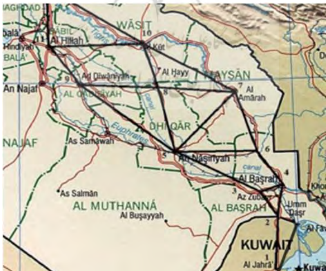
شکل (۲) نقشه مسیرهای زمینی بین دو کشور عراق و کویت

نقشه مسیرهای زمینی بین عراق و کویت در جنگ سال ۱۹۹۰ در شکل (۲) نمایش داده شده است. در شکل (۳) شبکه حاصل از این نقشه نشان داده شده است. S مبدا حرکت نیروهای عراقی در خاک عراق و t مقصد آن‌ها در خاک کویت می‌باشد. دو نوع نیروی شناسایی فرض می‌شود و برای هر نوع تنها یک نیرو در نظر گرفته می‌شود. مقادیر احتمال شناسایی برای هر کمان و نیروی شناسایی در جدول (۲) ارائه شده است.