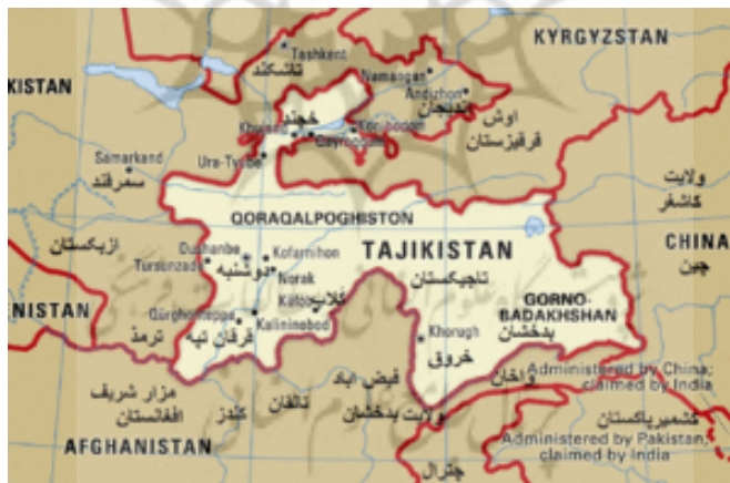
شکل ۱. نقشه کشور تاجیکستان

بی‌شک موقعیت را باید یکی از مهم‌ترین عوامل ژئوپلیتیکی تاجیکستان دانست. واقع شدن در قلب اوراسیا، چهارراهی میان شرق و غرب و شمال و جنوب، همجواری با قدرت‌هایی مانند چین و تاثیر و نفوذ تاریخی و فرهنگی ایران و روسیه، موقعیتی شگرف برای تاجیکستان به ارمغان آورده است. این کشور هم از موقعیت ویژه‌ای جهت نفوذ و حمله به همسایگان و مناطق پیرامونی خود برخوردار بوده و هم موقعیت مناسبی جهت دفاع برای مناطق پیرامونی خود و همین‌طور دفاع و مقابله در برابر تهاجم همسایگان بهره‌مند می‌باشد. تاجیکستان موقعیت ممتازی برای مسیرهای حمل و نقل و تجاری مانند مسیرهای انتقال انرژی به شمار می‌رود. البته در کنار موقعیت استراتژیک تاجیکستان که باعث جلب توجه و حضور قدرت‌های منطقه‌ای و فرامنطقه‌ای گشته، برخی مشکلات دیگر مانند محصور بودن در خشکی باعث وابستگی این جمهوری به کشورهای دیگر شده است.