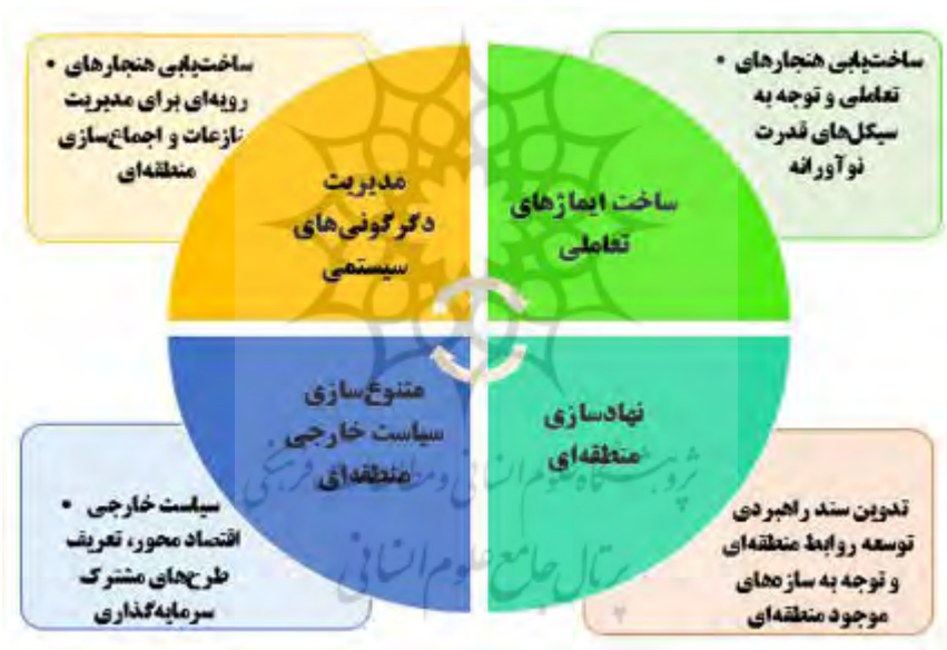
شکل ۳. کارویژه‌های سیاست خارجی کارآمد منطقه‌ای؛ طرحی برای ایران

جمعی برای توسعه روابط منطقه‌ای و شبکه‌سازی‌های جدید در جهت کارآمدسازی سیستمی - نهادی سیاست خارجی است. به‌طور مثال عربستان سعودی به‌تازگی با افتتاح دفتر چشم‌انداز سعودی- ژاپن ۱ در ریاض درصدد گسترش چارچوب‌های مشارکت فراگیر در منطقه بوده است (Rabi & Mueller, 2018, p.61-63). بر همین اساس ایران هم باید با تعریف طرح‌های مشارکتی در چارچوب مشارکت فراگیر منطقه‌ای با بازیگران منطقه‌ای که در آینده‌ای نزدیک از قطب‌های مهم توسعه‌یافتگی خواهند بود از جمله قطر در منطقه خلیج‌فارس و ترکیه در خاورمیانه و تعریف طرح‌هایی با کشورهای شرق آسیا از جمله سنگاپور، تایوان و اندونزی، خواهد توانست بر میزان کنشگری و کارآمدی سیاست خارجی بیفزاید.