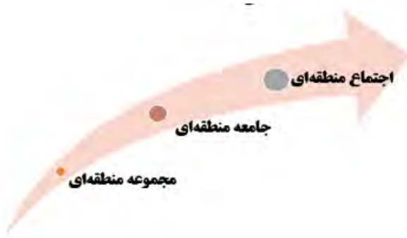
شکل ۲. مسیر گذار از محیط تقابلی به بستر تعامل محورانه منطقه‌ای

و به نوعی منجر به کارآمدسازی سیاست خارجی دولت‌های درگیر در این پروسه می‌شود و می‌تواند در قدرت‌کنشگری بین‌المللی آنان هم مؤثر باشد.