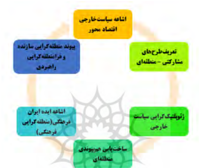
شکل ۴. راهکارهای پیگیری سیاست خارجی کارآمد و موفق منطقه‌ای

۶) افزایش ارتباطات منطقه‌گرایی برای تسری آن در ابعاد فرامنطقه‌گرایی.