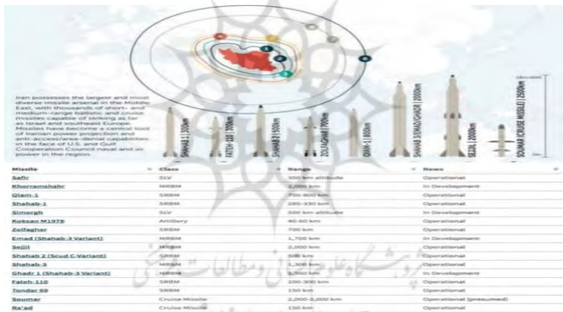
شکل ۱. موشک‌های کروز و بالستیک ایران

۱۱۰ در سال ۱۹۹۵ را آغاز کرد و اولین تست جنگی آن در سال ۲۰۰۱ انجام شد و در سال ۲۰۰۴ عملیاتی شد. (CSI, 2018) در مرحله بعد جمهوری اسلامی ایران با توجه به تجربیات خود تولید موشک‌های کروز را در دستور کار خود قرار داد. موشک‌های کروز مزایایی زیادی دارند. سرعت کم و پرواز در ارتفاع پایین باعث دقت زیاد این تسلیحات می‌شود. این موشک‌ها قابلیت شلیک از زیردریایی‌ها، هواپیماهای جنگی و نیز زمین را دارند. ویژگی دیگر آن‌که، سطح مقطع راداری کم و پرواز در سطح پایین باعث می‌شود تا تشخیص آن‌ها توسط سامانه‌های راداری و پدافندی مشکل شود. ایران در سال‌های گذشته انواع مختلفی از موشک‌های کروز و بالستیک را در بردهای متنوع تولید کرده‌است. در ادامه به بررسی ویژگی‌های راهبردی تسلیحات موشکی می‌پردازیم.