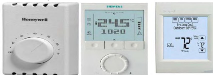
شکل ۳- نمونه رابط کاربری گرافیکی ثبت شده به عنوان اختراع در ایران