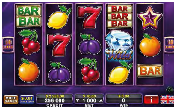
شکل ۱- نمونه رابط کاربری گرافیکی ثبت شده در اتحادیه اروپا ۱

قابل ذکر است که کشورها رویه‌های مختلفی در این خصوص اتخاذ کرده‌اند. در برخی نظام‌های حقوقی مانند اتحادیه اروپا، فرانسه، آلمان، انگلیس و برزیل، رابط کاربری گرافیکی به‌طور مستقل قابل ثبت است و نیازی نیست که کالایی که رابط کاربری برای آن به کار می‌رود تعیین گردد. در مقابل در برخی کشورها مانند چین، ژاپن و ایالات متحده آمریکا این الزام وجود دارد که کالایی که رابط کاربری برای آن استفاده می‌شود، به‌صورت نمایش گرافیکی یا در قالب توصیف به اداره مربوطه ارائه گردد.