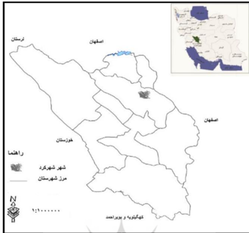
شکل ۱. موقعیت محدوده مورد مطالعه، منبع: نگارندگان، ۱۴۰۰

نتایج نشان دهنده آن است که فرض نرمال بودن برای تمام متغیرها را نمی‌توان رد کرد ( P > 0.05 ). نتایج این آزمون در جدول (۲) آورده شده است. براساس جدول (۲) کلیه متغیرهای مورد بررسی در وضعیت نرمال قرار دارند.