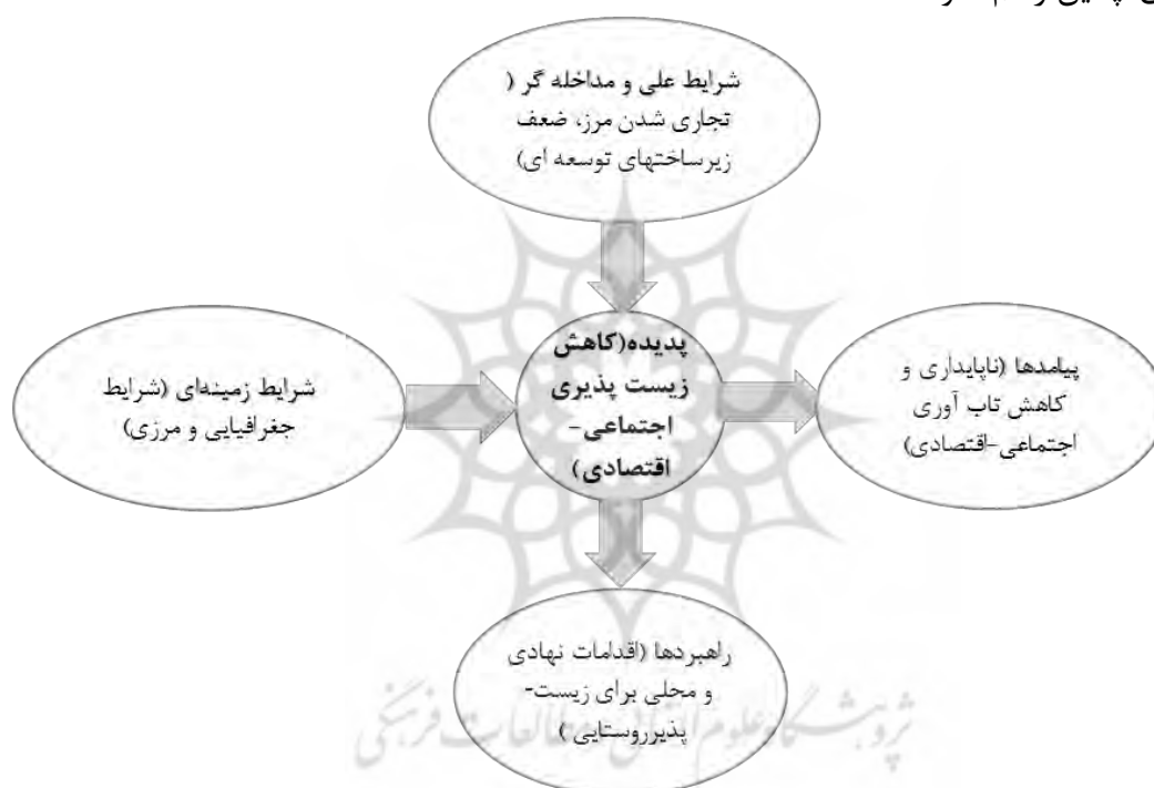
شکل ۲. مدل پارادامیک پژوهش

بنابراین، و با توجه به یافته‌ها، می‌توان مدل پارادامیک پژوهش حاضر را براساس روش‌شناسی نظریه زمینه‌ای چنین رسم نمود: