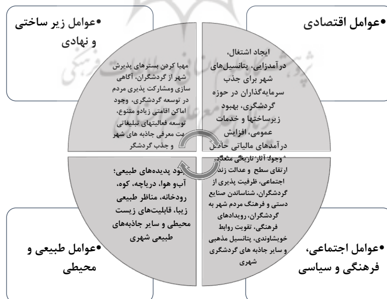
شکل ۱- عوامل تأثیرگذار بر اقتصاد گردشگری شهری و ایجاد درآمد پایدار

یکی از مهم‌ترین اقدامات عملی برای پایدارسازی درآمدهای شهرداری‌ها به ویژه در کلان‌شهرها، استفاده از پتانسیل‌ها و توان‌های اقتصادی گردشگری می‌باشد. گردشگری، یکی از ارکان اصلی و محرک اقتصادی بسیاری از شهرهاست که نقش مهمی در اشتغال، درآمد و حفاظت زیرساخت‌ها و خدمات عمومی شهری برعهده دارد. با توجه به تکالیف قانونی شهرداری‌ها در برنامه پنجم و ششم توسعه در ایجاد نظام درآمدی پایدار، استفاده از ظرفیت‌های گردشگری می‌تواند نقش به‌سزایی در تأمین درآمد برای شهرداری‌ها داشته باشد. شهرداری‌ها با توجه به نقش اساسی خود در توسعه گردشگری می‌توانند با برنامه‌ریزی و مدیریت صحیح و سرمایه‌گذاری در ارائه خدمات گردشگری، درآمدی پایدار را برای شهرهایشان ایجاد کنند. گردشگری شهری می‌تواند تصویر و برند ثابتی برای شهر طرح‌ریزی و اجرا کند که موجب بهره‌وری تمام خدمات و فعالیت‌های ارائه شده توسط شهرها می‌شود. در نتیجه برای ساکنان و شهرها ایجاد ارزش کرده و درآمد قابل توجهی فراهم می‌نماید (عبیدی‌زادگان و حاجی‌لو، ۱۳۹۵). شهرداری‌ها