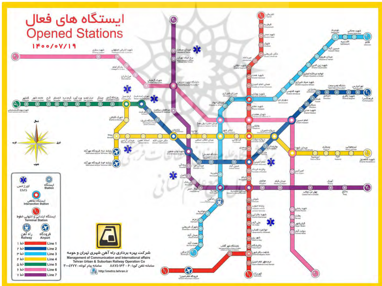
نقشه ۱- خطوط ریلی مترو تهران

احداث قطار شهری در تهران به ۱۱۰ سال قبل بازمی‌گردد. تأسیس تاراموای شهری از جمله موارد پیش‌بینی شده در امتیازنامه‌ای بود که بارون ژولیوس دو رویتر در عهد ناصرالدین شاه روی کاغذ آمد. در همین سال‌ها یک خط آهن روزمینی بین دروازه شهر ری (حضرت عبدالعظیم) و میدان باغ شاه، با نام معروف ماشین دودی ساخته شد. شرکت سوفرتو و شرکت متروی فرانسه در سال ۱۳۵۰، مطالعات اجتماعی،