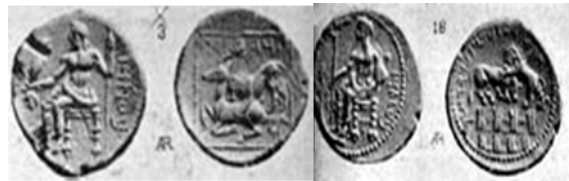
سکه‌های مازہ ساتراپ کیلیکیه (بیانی، دوره سه، ش ۳۲ و ۳۳، صص ۱۷-۱۹).

در حال دریدن اهو می‌باشد، نقش شده است و نیز برج و باروی شهر که در تصویر بالای شیر در حال دریدن اهو دیده می‌شود. (تصاویر سکه‌های مازہ که در کیلیکیه ضرب شده‌اند و مربوط به سال‌های ۳۶۱ تا ۳۳۳ پ.م در کیلیکیه است که در تصویر زیر مشاهده می‌شود).