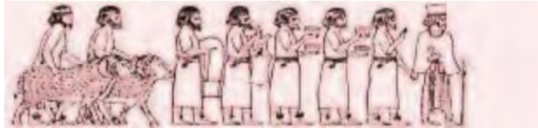
نمایندگان ساتراپی‌ها در پلکان شرقی کاخ آپادانا (سعیدی، ۱۳۷۶: ۹۳).

شاهنشاه هدیه می‌آورند را کیلیکیه‌ای می‌داند (Lincoln, 2007: 75-78; Curtis, 2003:4). گویا این تصور از شباهت کیلیکیان با آشوریان در نوع پوشش و ظاهر آنان بوده و باید انگاره‌ی کیلیکیه‌ای بودن آنها کنار گذاشته شود (Roaf, 1983: 51, 62, 130; Briant, 2002: 175).