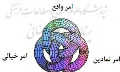
شکل ۲- گره برومه‌ای و ارتباط ساحت‌های واقع، خیالی و نمادین

روان کاوی به ما می‌آموزد که زندگی روانی ما، تنها به آنچه «خودآگاه» و عقلانی می‌نامیم، محدود نمی‌شود؛ بلکه خودآگاه، همواره همبسته‌ای به نام «ناخودآگاه» دارد که فعال شدن آن بر کنش/واکنش سوژه‌ها تأثیرگذار خواهد بود (شاریه، ۱۳۷۰: ۱۷؛ Braddock, 2011: 640). روان کاوی سیاسی مکتب لکانی با تمرکز بر ناخودآگاه و بیان این مطلب که ناخودآگاه، ساختاری همچون زبان دارد، به نقش روبنا و کلان ساختارها در شکل‌گیری ناخودآگاه جمعی و کنش/واکنش‌های سیاسی-اجتماعی منبث از آن می‌پردازد. در واقع نوآوری لکان، تلاش برای آزادسازی ناخودآگاه از چنبره تحلیل‌های محدود بیولوژیکی فرویدی بود؛ جایی که تأثیرات «پدر» بیولوژیکی و لیبیدویی فرویدی بر ناخودآگاه، به کارکرد «نام پدر» ۱ در سطح نمادین و زبانی، ارتقای درجه پیدا کرده و ناخودآگاه تحت تأثیر قواعد دال ساخت‌بندی می‌شود. از این‌رو لکان فرایند رشد روانی انسان را در سه مرحله نظم خیالی ۲ ، نظم نمادین ۳ و نظم واقع ۴ بر مبنای گره برومه‌ای به شکلی درهم تنیده توصیف می‌کند (پاینده، ۱۳۸۸: ۲۸؛ دی پالمر و دانکلبرگر، ۱۳۹۵: ۹۳؛ ژیتک، ۱۳۹۲: ۷؛ ساراپ، ۱۳۸۲: ۱۸-۲۱؛ شیری و دیگران، ۱۳۹۱: ۸۵؛ علی، ۱۳۹۳: ۹۷؛ قنبری، ۱۳۹۶: ۵۷؛ هومر، ۱۳۹۴: ۹۷-۹۸؛ ۵۴؛ Azzone, 2016: 3-4; Young, Lothane, 2003: 85-86; 2003: 307-308).