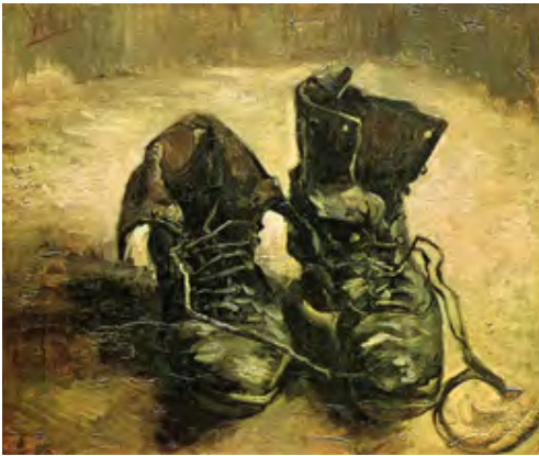
شکل ۲ کفش‌های وان‌گوت - ۱۹۸۶ منبع: