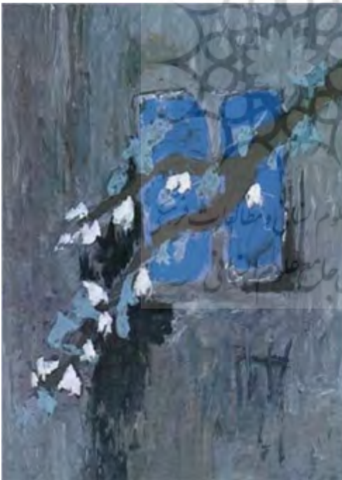
شکل ۲ سهراب سپهری