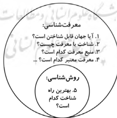
شکل ۱: نحوه ارتباط معرفت‌شناسی و روش‌شناسی (ترسیم‌شده بر اساس: سجادی، ۱۳۷۶).

در جست‌وجوی پارادایم‌های ارتباطی و تعاملی بین معرفت‌شناسی و روان‌شناسی