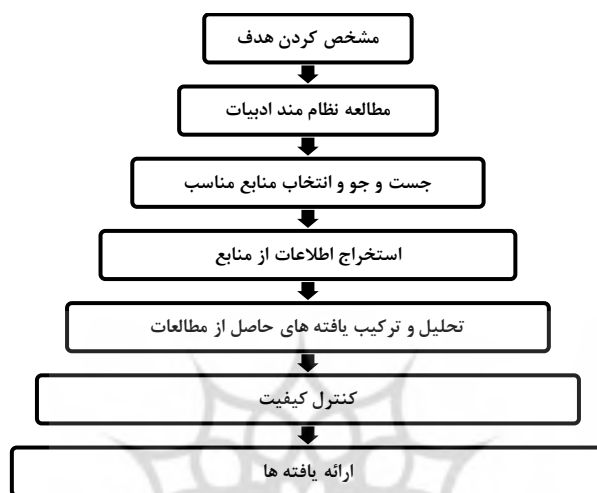
شکل ۱: مراحل و روش کلی فرا ترکیب (تانگ و همکاران، ۲۰۰۷: ۳۵۱).

می‌کند (تانگ و همکاران ۱۳ ، ۲۰۰۷: ۳۵۰)، به همین دلیل در این تحقیق از این روش هفت مرحله‌ای استفاده شده است.