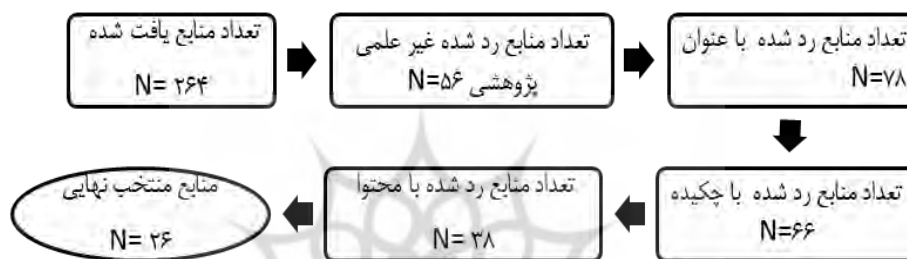
شکل ۲: مراحل انتخاب چک لیست پژوهش‌های مورد مطالعه از پایگاه‌های اطلاعاتی منتخب

فرآیند پالایش و بازبینی با توجه به ملاک‌های ورود و خروج مذکور به طور اجمالی در شکل ۲ آورده شده است.